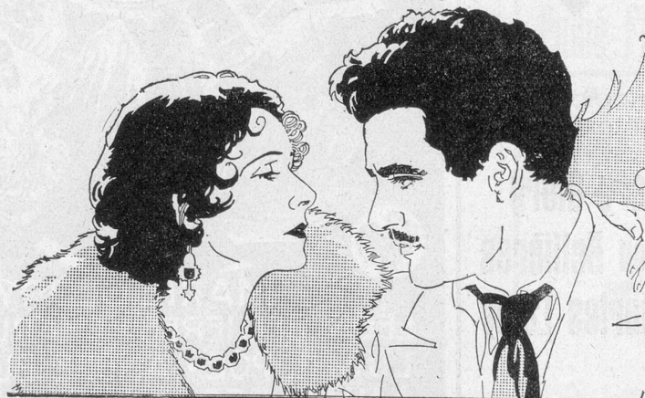
Norma Talmadge et Gilbert Roland dans « Nuits de New-York ».

Il semble qu'en Suisse, le parlant a amené au cinéma de nombreux nouveaux fidèles. Les recettes sont généralement en augmentation notable ; heureusement d'ailleurs, car les prix de location eux aussi sont en grande hausse.