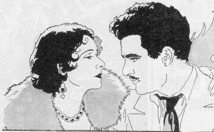
Norma Talmadge et Gilbert Roland dans „Nuits de New-York“.

Il semble qu'en Suisse, le parlant a amené au cinéma de nombreux nouveaux fidèles. Les recettes sont généralement en augmentation notable ; heureusement d'ailleurs, car les prix de location eux aussi sont en grande hausse.