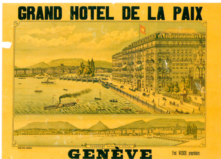
Fig. 1 Linden, Grand Hôtel de la Paix, Genève, vers 1890

Les lieux d'affichage sont une des clés de leur réussite: destinées aux voyageurs, ces publicités doivent attirer leur regard. Elles sont donc apposées dans les endroits où ils passent et attendent – moment où ils sont particulièrement réceptifs: halls de gares, agences de voyage, bureaux de poste, offices de tourisme, paquebots transatlantiques.