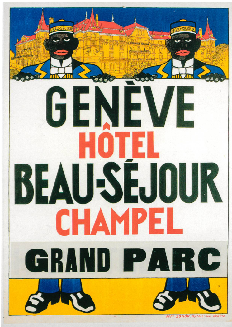
Fig. 3 Henry Claudius Forestier, Hôtel Beau-Séjour, Genève Champel, 1907

par un artiste spécialisé alors que le paysage était confié à un autre. Des images d'intérieur, comme celle de l'affiche anonyme Hôtel Storchen Basel (vers 1890), sont exceptionnelles; encore ne s'agit-il ici que d'une représentation de la salle de billard parmi d'autres vues extérieures de l'hôtel. Les affiches d'établissements hydrothérapeutiques montrent plus fréquemment les intérieurs afin de souligner l'excellence et la modernité des installations ou des salles de détente ( Grand Hôtel des Bains, Bex , 1899, Neuen Stahl-Bad St. Moritz , 1885).