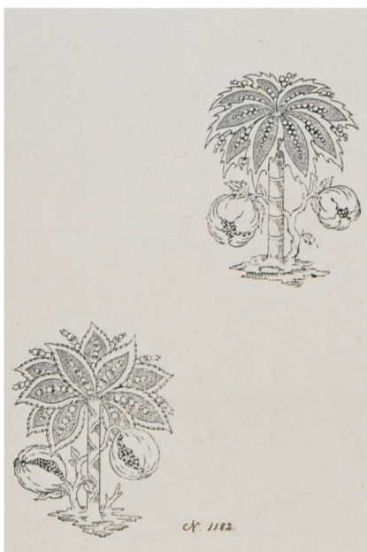
Fig. 1 : Palmettes et fleurs imaginaires aux tiges ondulées, vers 1790, encre sur papier, numéroté « n° 1182 »

Les archives de la Fabrique neuve de Cortaillod, active entre 1752 et 1854 dans le domaine de la toile imprimée, sont conservées aux Archives d'Etat de Neuchâtel et recèlent plusieurs milliers d'esquisses et de modèles d'indiennes.