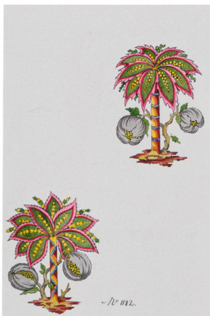
Fig. 2 : Palmettes et fleurs imaginaires aux tiges ondulées, vers 1790, encre et aquarelle sur papier hollandais avec filigrane « HONIG », numéroté « n° 1182 »

A la fin du XVIII e siècle, la Principauté de Neuchâtel voit s'épanouir une industrie textile tout à fait particulière: il s'agit des indiennes, ces toiles de lin imprimées produites en manufacture dans la région de Colombier, Boudry et Cortaillod notamment 1 . Si Neuchâtel n'est pas le seul territoire helvétique à abriter ce type de production – Genève accueille la même industrie –, ses entreprises ont laissé subsister sinon les produits eux-mêmes, assez fragiles et sujets aux modes 2 , du moins leurs archives. Celles de la Fabrique neuve de Cortaillod, conservées aux Archives d'Etat de Neuchâtel sont particulièrement complètes. Si elles ont déjà été exploitées par les historiens pour écrire l'épopée de cette entreprise et de ses acteurs, les produits eux-mêmes n'ont pas eu l'heur d'être observés avec attention. Pourtant, dans la vingtaine de cartons d'esquisses et de modèles d'indiennes que les archives conservent, ce sont des milliers de dessins au crayon ou à l'encre, d'aquarelles qui témoignent encore du savoir-faire des dessinateurs et de leur inventivité stupéfiante. Ces croquis, ces études préparatoires datent du dernier quart du XVIII e siècle et du début du XIX e siècle, selon les rares inscriptions figurant sur quelques-uns des échantillons. Le porte-folio qui accompagne cette brève introduction a pour ambition de lever le voile sur cette collection étonnante et de susciter une étude de plus grande ampleur.