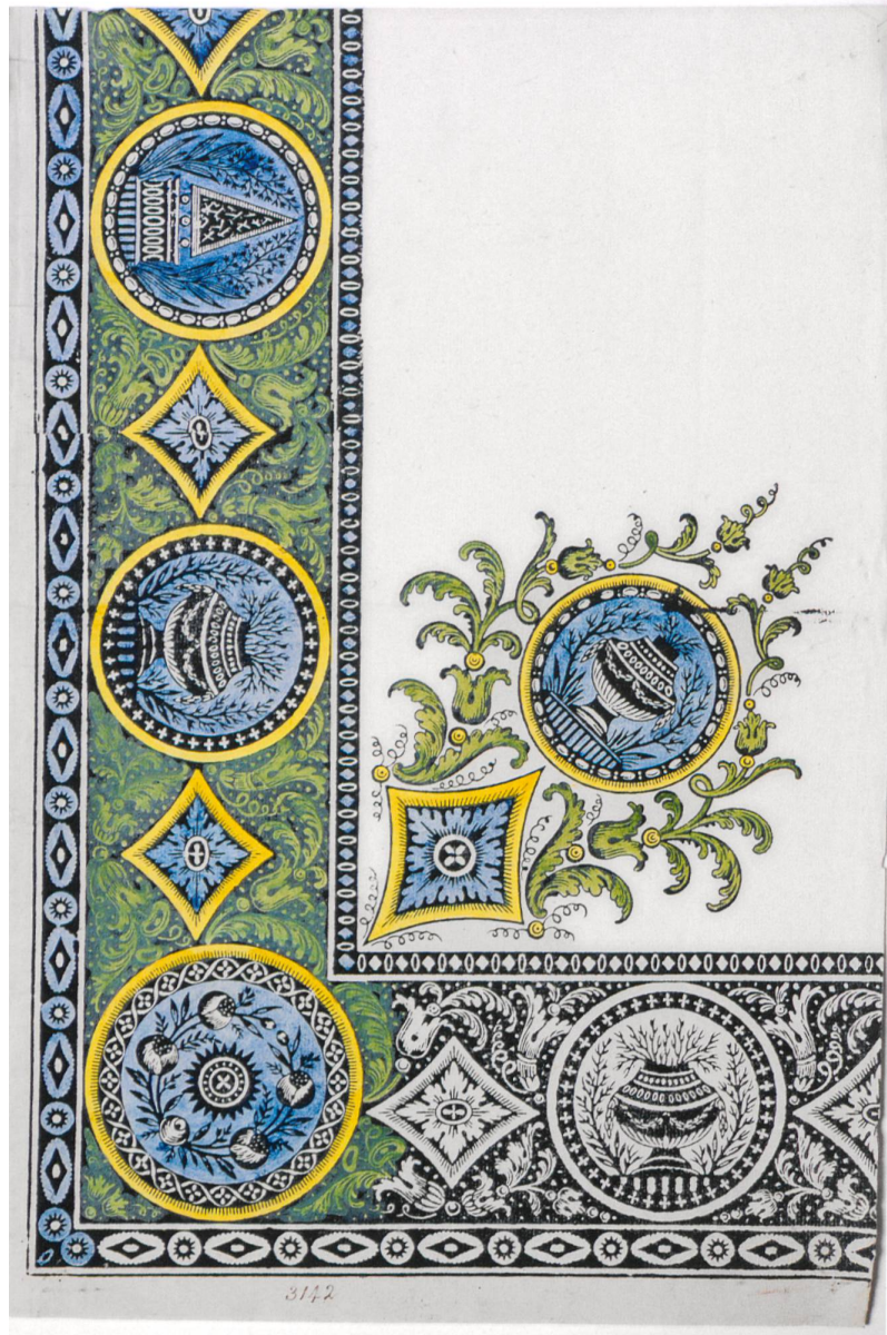
Fig. 16 : Bordure avec dense feuillage, losanges, médaillons avec roses organisées en couronne, urnes et obélisques, vers 1805, encre et aquarelle sur papier, numéroté « n° 3142 »