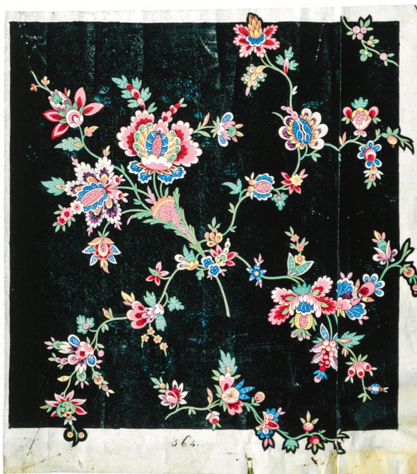
Fig. 6 : Fleurs imaginaires sur fond noir, vers 1780, aquarelle sur papier, numéroté « n° 564 »

La collection de la Fabrique neuve de Corneillemont ne manque pas non plus de « chinoïseries ». Elles marquent les arts décoratifs du XVIII e siècle, avec des interprétations différentes selon les époques et les goûts, comme cet exemple des années 1780 avec des pagodes placées en rayures verticales reliées par des guirlandes et des médaillons fleuris (fig. 17). Conformément à l'esthétique du premier quart du XIX e siècle, on s'éloigne toujours plus d'une approche réaliste de la nature (fig. 18), les dessins se font en courbes, se simplifient, les couleurs non-naturalistes se détachent d'un fond noir qui rend la représentation encore plus irréaliste, comme c'est le cas de ce feuillage aux couleurs automnales (fig. 19). Dans le répertoire des dessins existent aussi, mais dans une moindre ►