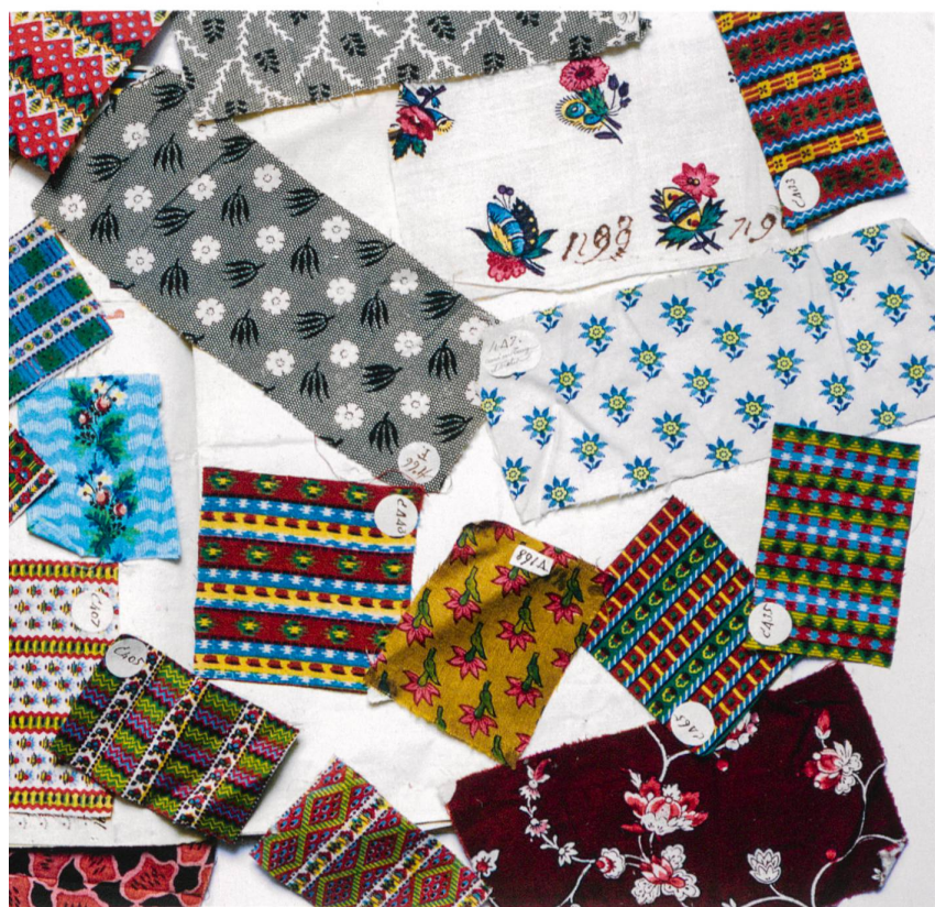
Fig. 20 : Echantillons numérotés, vers 1780-1825, aquarelle sur papier (à gauche)

Gli archivi della Fabrique-Neuve di Cortaillod, attiva dal 1752 al 1854 nel settore delle tele stampate, sono conservati presso l'Archivio di Stato di Neuchâtel e comprendono alcune migliaia di bozzetti e modelli di indiane, che non sono ancora stati studiati a fondo. L'esame dei numerosi disegni pone in luce un sorprendente repertorio di motivi e ornamenti, destinati, attraverso le tele di cotone stampate, a ornare gli abiti e a decorare gli interni delle abitazioni. Se alcuni schizzi si rifanno ai modelli dipinti in India, altri si richiamano in modo più o meno esplicito alla flora europea e al vocabolario storico dell'epoca. Nella prospettiva di una storia culturale e sociale del gusto, l'approccio interdisciplinare e internazionale a queste testimonianze artistiche consente non solo di cogliere la complessità e la ricchezza del linguaggio ornamentale, ma anche di riconoscere l'estetica distintiva di questo preciso periodo storico. Un simile approccio rivela inoltre nuove analogie tra l'arte del tessuto stampato e gli straordinari sviluppi delle arti decorative tra la seconda metà del XVIII secolo e la prima metà del XIX secolo.