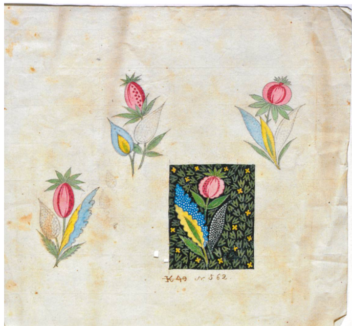
Fig. 4 : Fleurs imaginaires, vers 1790, crayon et aquarelle sur papier, numéroté « n° 562 »

tendu de velours cramoisi et ses sièges couverts de même 4 . La plupart des autres pièces présentent en revanche un aménagement partiellement ou totalement tendu d'indiennes : la lumière tombant des hautes baies de la grande salle à manger de marbre voisine est ainsi tamisée par des rideaux d'indienne bleus et blancs, la bibliothèque montre une « tenture d'indienne, [u]ne paire de rideaux de fenêtres d'indienne avec bordure » 5 . Souvent, c'est la parure du lit qui est d'indienne, ou quelque pièce du mobilier : dans la chambre principale, au premier étage, le lit est garni de satin blanc, ses rideaux sont en étoffe de laine verte, mais son couvre-pieds est d'indienne piquée alors qu'une cotonnade imprimée rouge recouvre aussi un canapé, huit fauteuils, quatre tabourets et deux petites chaises (où l'indienne est rouge et blanche). Le mélange des types de tissu n'effraie pas : c'est la gamme chromatique qui sert à unifier le tout, donnant fréquemment son nom aux pièces. Au château de Mollens, vers 1780, l'une des chambres présente ainsi « 1 lit complet, ciel et rideaux en laine verte, tapis d'indienne verte [et] 1 lit de repos avec matelas et coussins verts » 6 . Au temps de la gloire de l'industrie de l'indienne, les toiles peintes sont partout : tapissant les murs, garnissant les fenêtres, le mobilier, habillant les lits et, parfois, les dames de la maison.