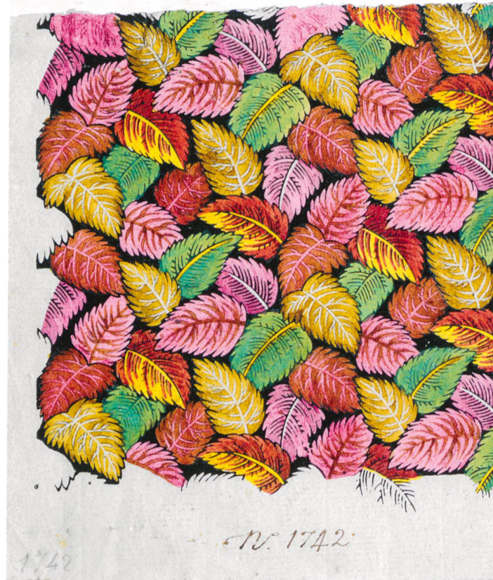
Fig. 19 : Feuillage automnal sur fond noir, vers 1820, aquarelle sur papier, numéroté « n° 1742 »