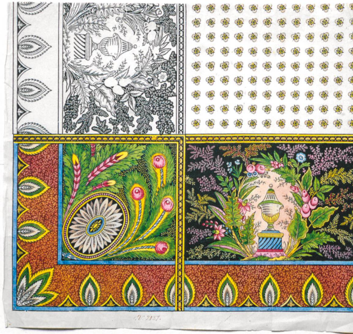
Fig. 18 : Fleurs organisées en couronnes, vases antiques sur fond de dense feuillage stylisé et petits motifs à répétition, vers 1815, encre et aquarelle sur papier, numéroté « n° 2127 »