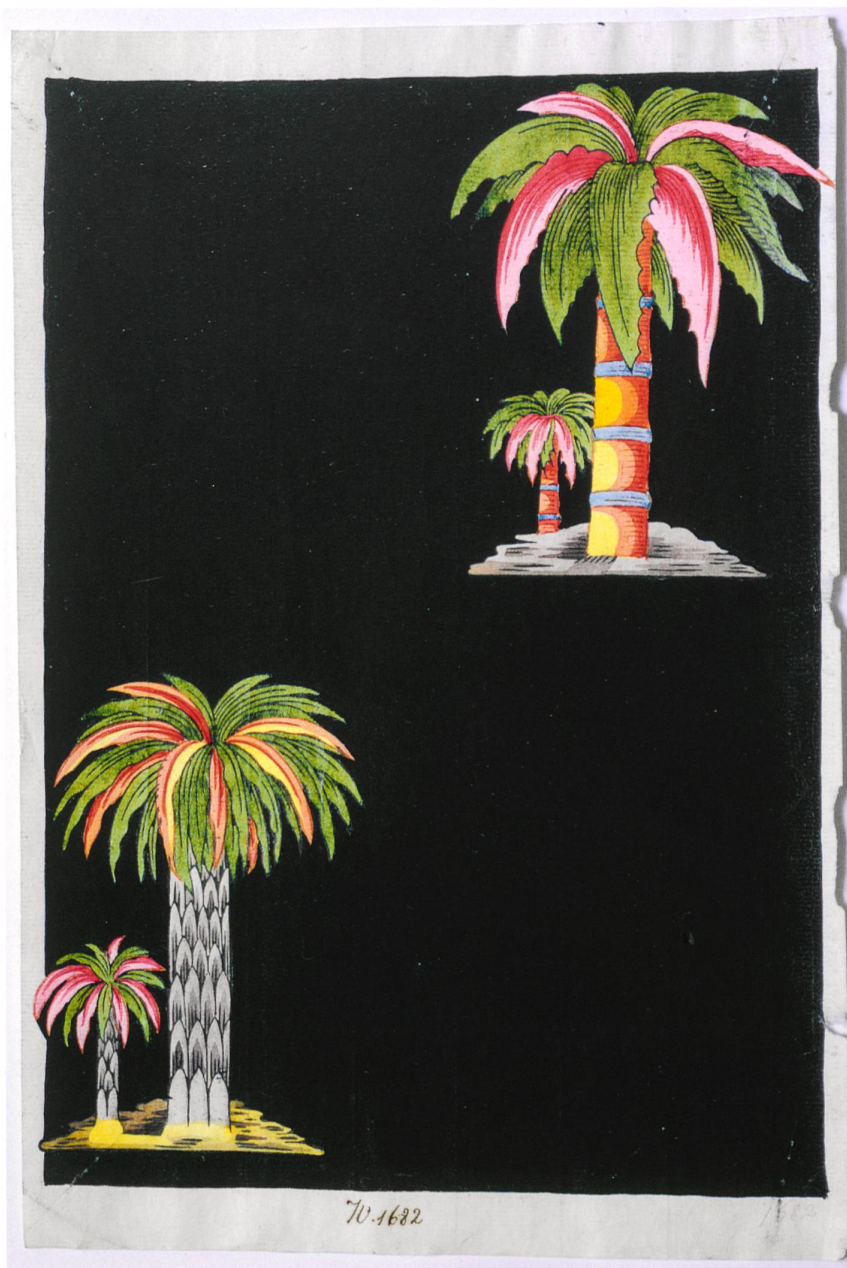
Fig. 3 : Palmettes sur fond noir, vers 1800, aquarelle sur papier, numéroté « n° 1682 »

Les diverses utilisations des indiennes sont bien connues : il s'agit surtout des secteurs de l'habillement et de l'ameublement. Les toiles de coton aux couleurs vives et aux petits motifs végétaux ou abstraits sont en effet très prisées pour les robes et les manteaux. Dans les intérieurs, leur usage est varié mais il n'est pas uniquement cantonné aux pièces secondaires comme on pourrait le penser de prime abord, même si les appartements de réception sont généralement traités dans des étoffes jugées sans doute plus nobles et moins sujettes au goût. Au château de Prangins, en 1786, le grand salon est ainsi ►