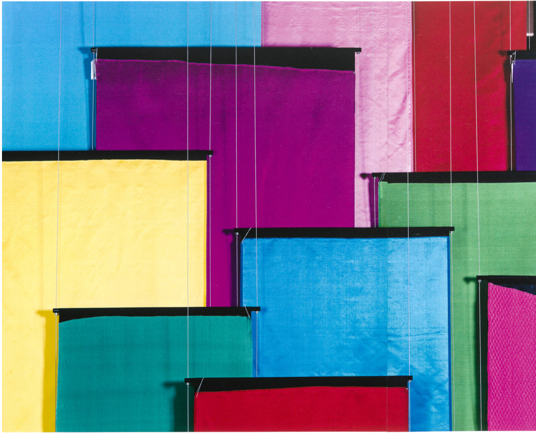
Uni-Thema. V.a. Satin double face, 1950-er bis 1990-er Jahre, Abraham AG, Zürich