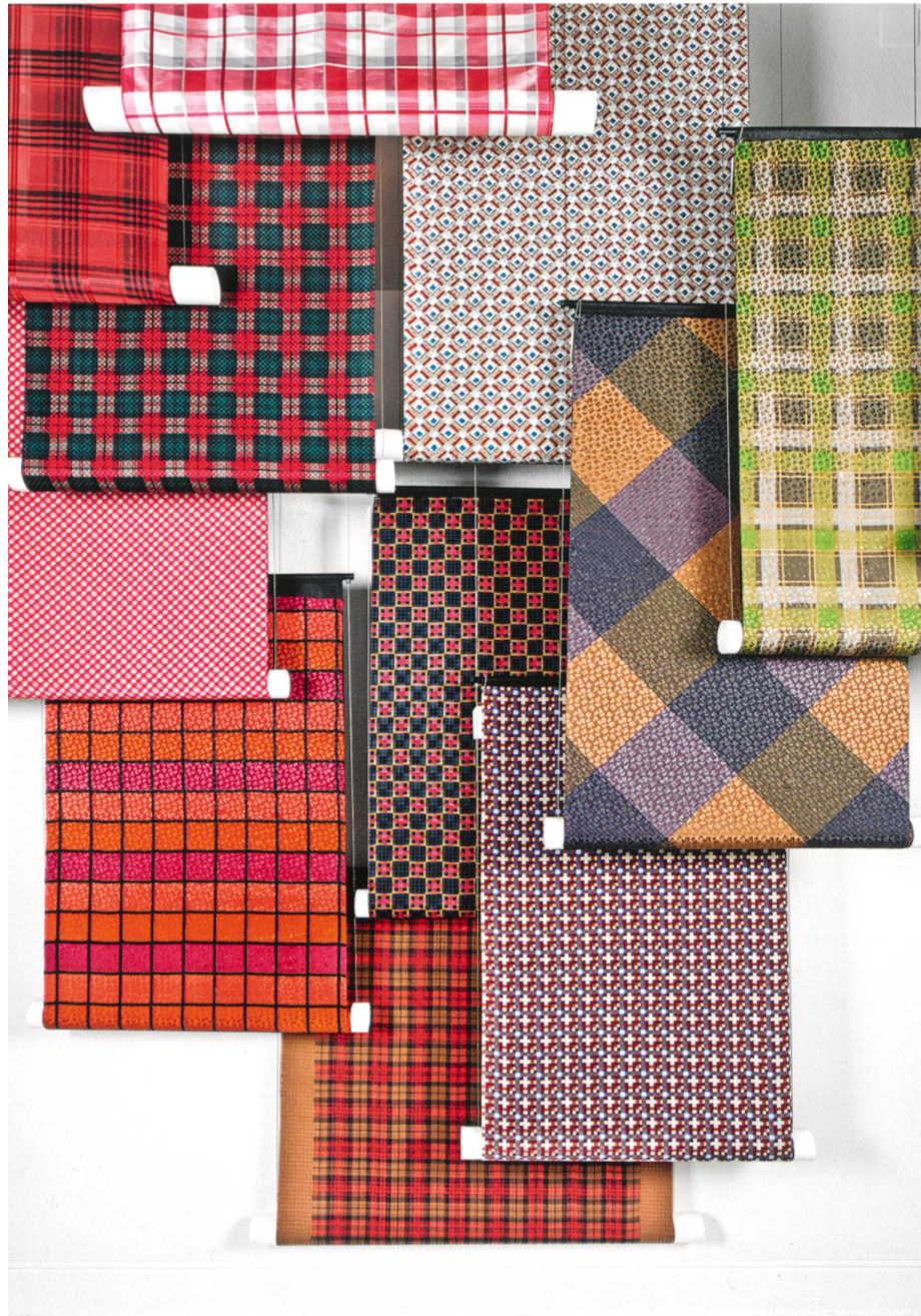
Karo-Thema. Stoffe, 1950-er bis 1980-er Jahre. Abraham AG, Zürich