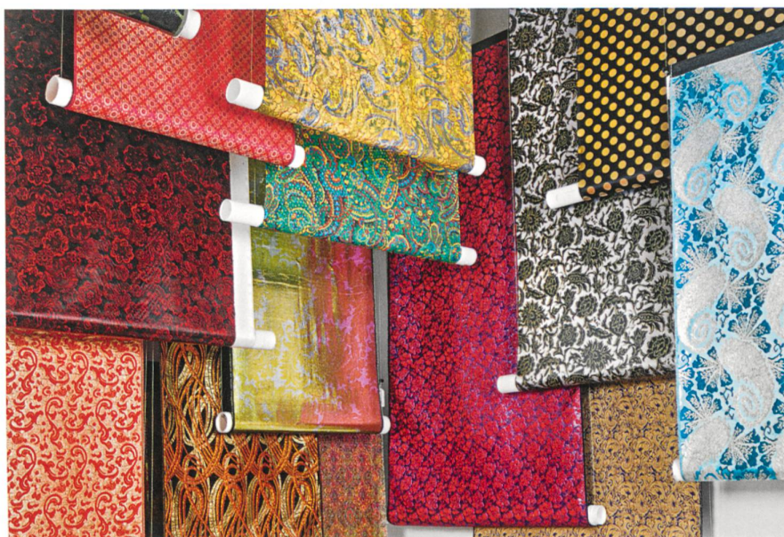
Glamour-Thema. Stoffe, 1960er bis 1990er Jahre. Abraham AG, Zürich

angebaut, aber das St. Galler Leinen galt als das beste. Dazu beigetragen haben die Qualitätsprüfung und das Vergeben eines Gütesiegels. Das St. Galler Leinen wurde auf den grossen ausländischen Märkten angeboten. Dieser gut organisierte Fernhandel durch Grosskaufleute hat sehr früh zum Ansehen der Schweizer Textilien beigetragen. Der Wohlstand der Schweiz beruht zum Teil auf der Textilindustrie, ebenso das Bankwesen. Die Textilien sind identitätsstiftend. Es ist erstaunlich, wie viele Menschen in diesem Gewerbe gearbeitet haben, sich immer noch mit der Textilindustrie verbunden fühlen.