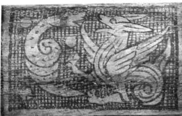
Basel, Schönes Haus, Erdgeschoss, Balkenmalereien, Ausschnitt: Panotier. (Sabine Sommerer, 2001)