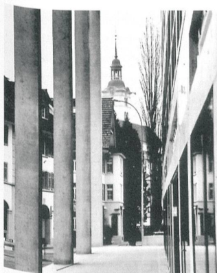
Blick durch den Stadthof in Sursee.

Die offizielle Preisübergabe wird am 6. September 2003 im Rahmen einer öffentlichen Veranstaltung gefeiert. pd