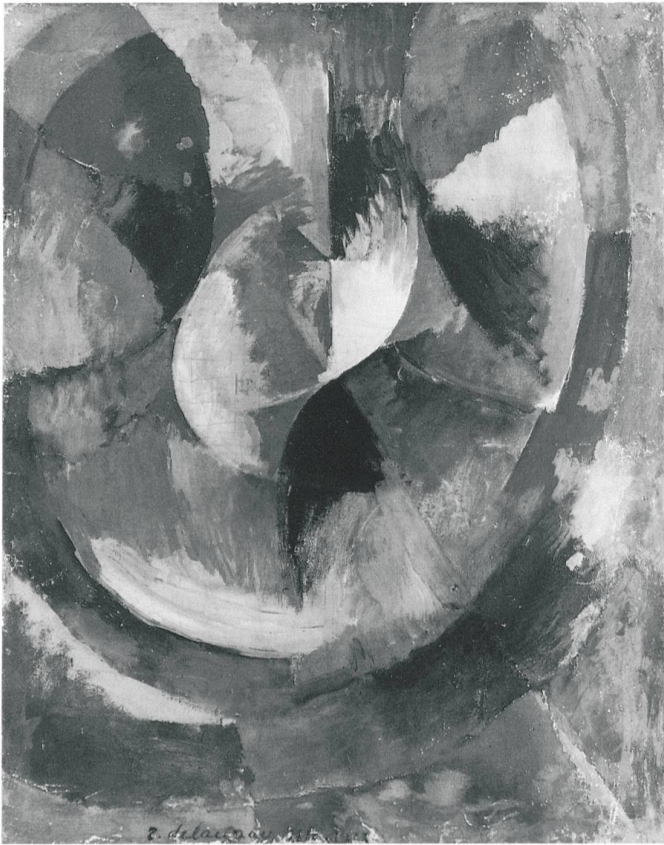
7 Robert Delaunay, Formes circulaires, soleil n° 3 , 1912, Öl auf Leinwand, 65 × 54 cm, Kunstmuseum Bern. – Delaunays orphistische Kompositionen, die auf der Kontrastwirkung reiner Farben beruhen, sind wegweisend für die Entwicklung der modernen Malerei.