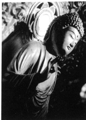
Statue des Buddha Amida, Japan, 18. Jahrhundert.

Ab 8. März 2003: «Bern und Europa – vom Frühmittelalter bis 1800» und «Von Krieg und Frieden – Bern und die Eidgenossen»