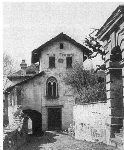
Locarno, Schloss, Nordfassade mit der alten Tor-durchfahrt.

Die Kapelle Allerheiligen in Grenchen, Stefan Blank, 24 S., Nr. 716, CHF 7.–. – Laut Baubeschluss des Solothurner Rates von 1682 sollte die Kapelle Allerheiligen in Grenchen in Grösse und Form der 1651–1654 errichteten Peterskapelle in Solothurn nachgebildet werden. Entstanden ist allerdings nicht eine Kopie des noch weitgehend spätgotischen Vorbildes, sondern eine