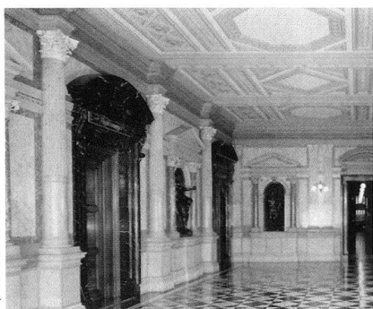
Bern, Bundeshaus, Vestibül bei den Vorzimmern der Bundesräte.

barockisierte, den Bedürfnissen einer Wallfahrtskapelle angepasste Version. Das Äussere der Kapelle ist eine eigenartige Vermischung zwischen Spätgotik und Barock. Das Innere lebt vor allem durch seine Einheitlichkeit der barocken Ausstattung. Vor allem die drei Altäre mit ihrem Skulpturenschmuck schaffen eine barocke Atmosphäre, wie sie in kaum einer solothurnischen Landkirche mehr derart unverfälscht und eindrucksvoll erhalten geblieben ist.