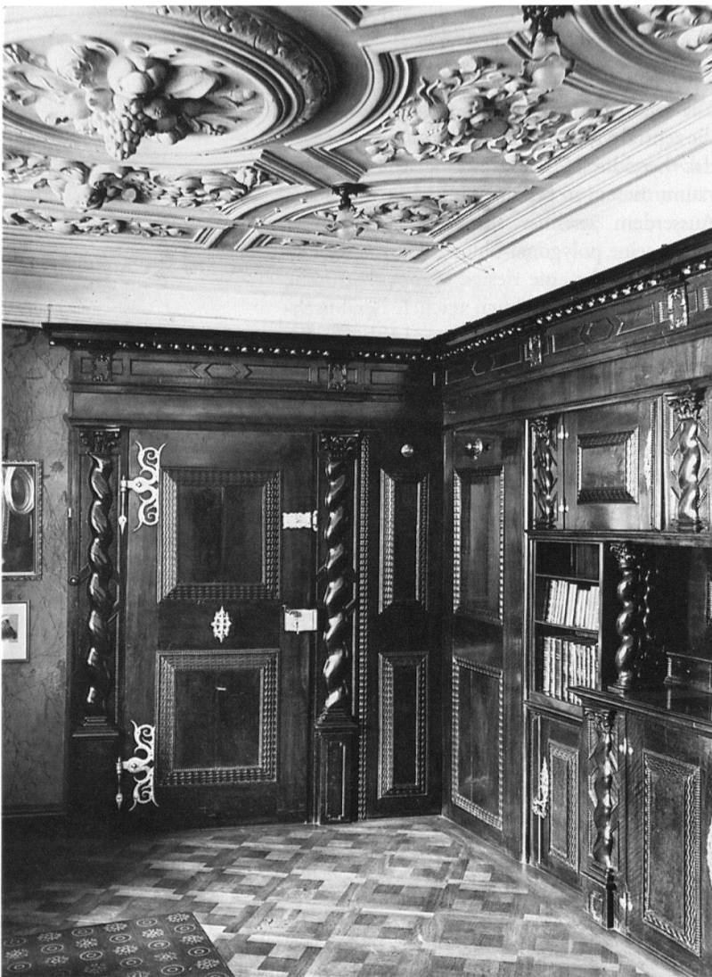
15 Prunkzimmer im «grossen Pelikan» in Zürich (Aufnahme 1917).

welche ein raumhohes Schmucktäfer kaum zulassen. Allenfalls hat ein niederes Knietäfer die bodennahe Wandzone bestimmt und die Prunktüren, wie sie auf Bocken erhalten sind, räumlich zusammengebunden. Gegenstück dazu bilden die kabinettartigen Räume im «grossen» (und im ehemaligen «kleinen») Pelikan. Das erhaltene Erkerzimmer im «grossen Pelikan» ist ein in seiner Gesamtheit durch Fotografien überliefertes Beispiel dafür (Abb. 15) 12 . Hier führt ein architektonisch gegliedertes Schmucktäfer, dem alle Raffinessen der damaligen Tischlerkunst (gemaserte Kissenfelder, Wellenstäbe, gedrehte Halbsäulen mit korinthisierenden Kapitellen und geschnitztes Knorpelwerk, dazu reichste ziseliierte und verzinnte Beschläge) eigen sind, vom Boden bis zum Gesimsansatz der Deckenkehlen. Darüber spannt sich stützenfrei die mittels Quadratur eingeteilte Stuckdecke mit plastisch akzentuiertem Relief. Die zentrale Traube im Mittelmedaillon, aber auch die Engelsköpfechen, sind vollplastisch herausgearbeitet und ragen sichtbar in den Raum. Was auf Bocken in räumliche Ausstattungsvarianten getrennt wird, – Stuck im Saal und Holztaferung in den Prunkzimmern, – verbindet sich hier zu einem kostbaren Kabinett, welches in seinem wertvollen handwerklichen Schmuckkleid auf der Höhe der zeitgenössischen Raumausstattung steht. Zu solchen barocken Prunkräumen tragen die künstlerisch hochstehenden, erfindungsreichen Decken Samuel Höschellers massgebend bei.