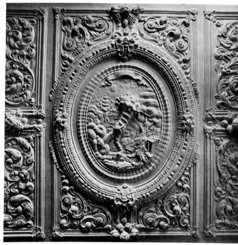
12/13 Zwei emblematische Motive aus der Saaldecke im «Bocken», Horgen.