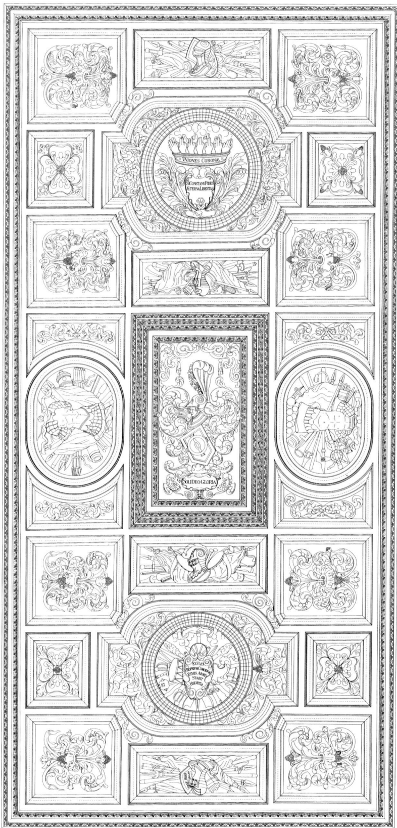
6 Fotogrammetrische Aufnahme der Saaldecke im Landsitz «Bocken» in Horgen (Atelier M. Stoppa, Zürich, 1992).

laufende Unterzüge in drei Zonen aufgeteilt wird. Die Saaldecke im «grossen Pelikan» zeigt sich über der Grundfläche von 12,00 × 5,75 Metern als dreizonige Kassettendecke mit drei unterschiedlich gestalteten Mittelspiegeln. Die Saaldecke auf Bocken – mit 11,20 × 5,45 Metern etwas kleiner – lässt sich als vielfeldrige, zentralsymmetrische Kassettendecke lesen, wel-