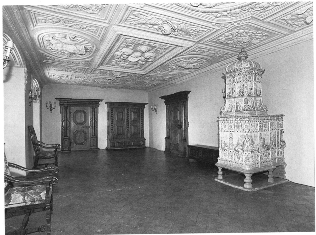
2 Horgen, Landsitz «Bocken». Ansicht des Festsaals gegen Süden. Stuckdecke von 1688.

Die Weggen-Meyer, so benannt nach ihrem Wappenzeichen, stammten ursprünglich aus dem Bäcker- und Müllergewerbe wie die mit ihnen verschwägerten Werdmüller, gingen je-