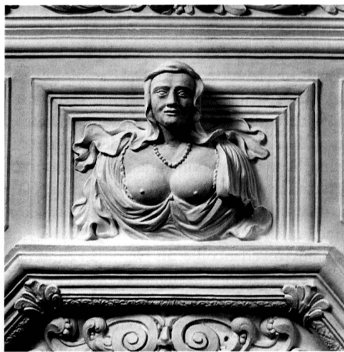
10/11 Männliche und weibliche Büste («Besitzerehepaar») aus der Saaldecke im Schloss Trüllikon.