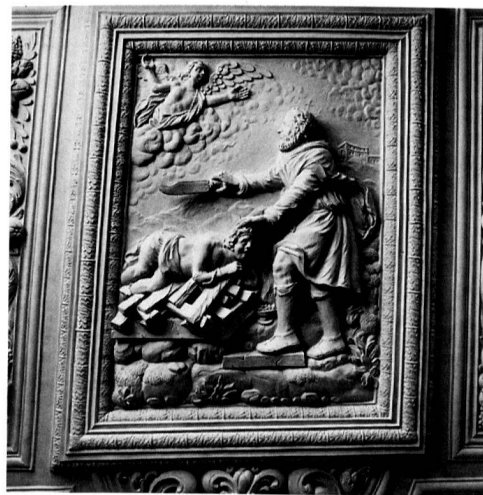
14 «Opfer Abrahams» aus dem Erdgeschosszimmer im «grossen Pelikan», Zürich.

Dieser Decke fehlt ein allegorisch-emblematisches Programm. Sie ist, mehr als alle andern, eine blosse Schmuckdecke mit alternierenden Ornamentfeldern. Immerhin wird auch hier das Zentrum von einer gerahmten Figur, emblematisch als christliche Hoffnung (Anker) und Liebe (brennendes Herz) zu deuten, bestimmt, deren Nachbarfelder geflügelte En-