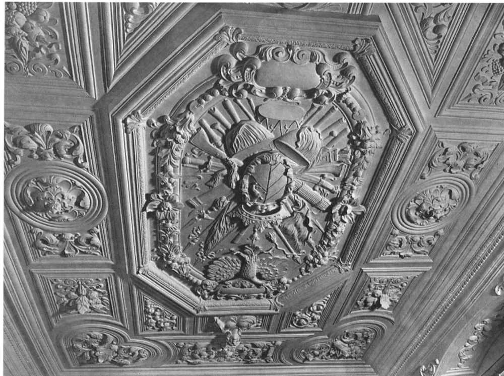
4 Mittelmedaillon der Saaldecke im Schloss Trüllikon mit dem Wappen Bürkli, datiert 1695.

Generalfeldmarschall Hans Heinrich Bürkli im Schloss Trüllikon