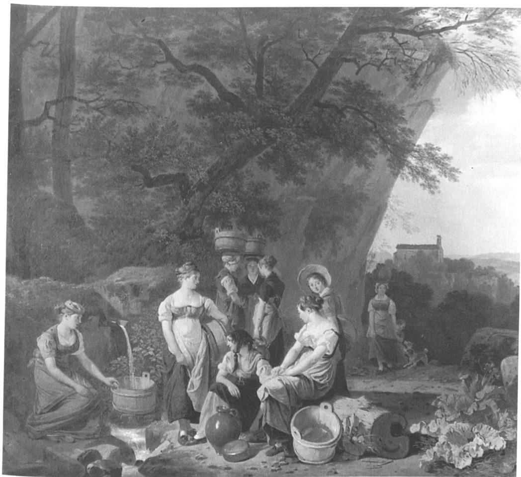
3 Wolfgang-Adam Töpffer, Jeunes femmes auprès d'une fontaine , huile sur toile, 56×67 cm. Collection particulière. – Médaille d'or à Berne 1830, figurant sous le n° 205, «ein Ölgemälde im Fache der Genrestücke von Herrn A. Töpffer von Genf».

Da wir also nun eben die Nummer 205: des jeunes filles auprès d'une fontaine, vor uns haben, und zwei angehende Künstler dieses Bild gerade in diesem Augenblick ebenfalls aufmerksam betrachten und ihre belobenden Betrachtungen darüber sehr lebhaft sich zuflüsternd; so wollen wir derselben Worte, so wie wir sie belauschten, als die beste Beschreibung und, wie uns dünkt, die richtige Beurtheilung darüber, unseren Lesern sogleich auch mittheilen: