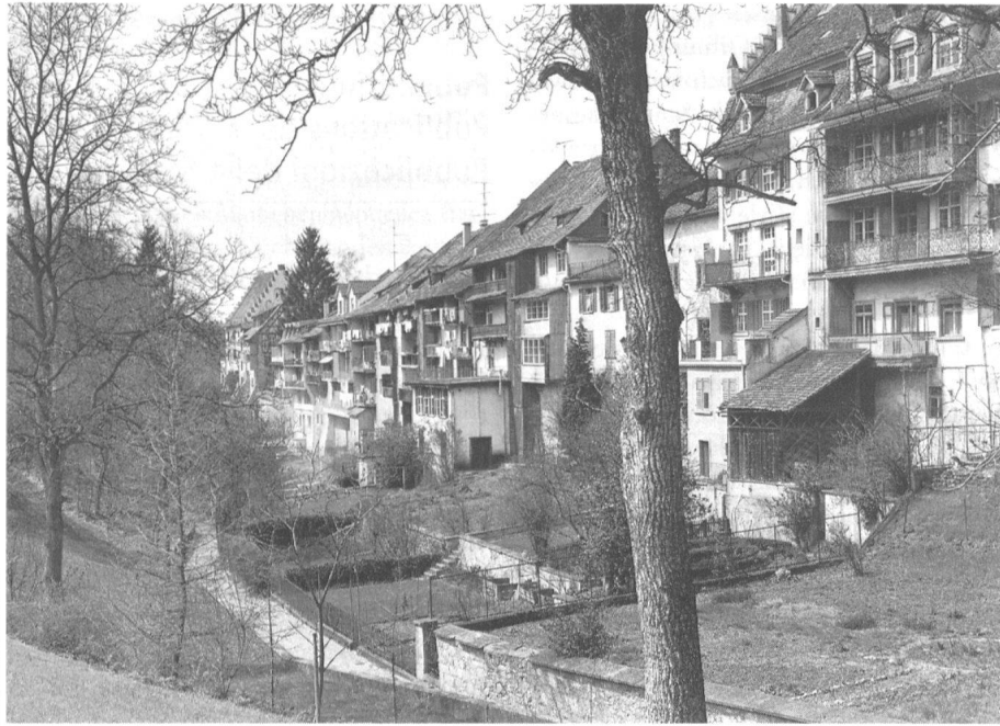
Bischofszell, die Grabenseite der südlichen Kirchgasszeile zwischen Dallerhäusern und Schloss

Peu connue, l' Eglise de la Croix de Zurich-Hottingen , une imposante église cruciforme à coupole réalisée par Pflughard & Haefeli, est l'un des plus remarquables édifices religieux de la Suisse de 1900. Edifice du gothique tardif à cinq nefs, l' Eglise Saint-Jean de Schaffhouse frappe par la clarté de ses généreux volumes, et tout particulièrement par ses riches voûtes réticulées des collatéraux extérieurs. Le dernier guide de cette série est