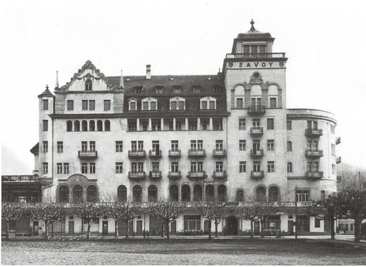
Interlaken → 5