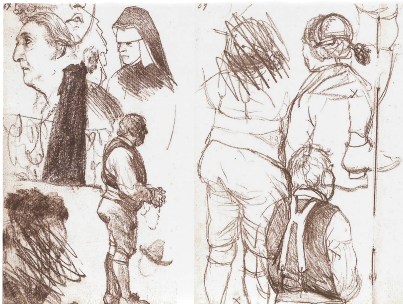
Abb. 4 Blick auf jedes Detail: Pilger mit Rosenkranz (14,7×8,7 cm). Kupferstichkabinett der Staatlichen Museen zu Berlin