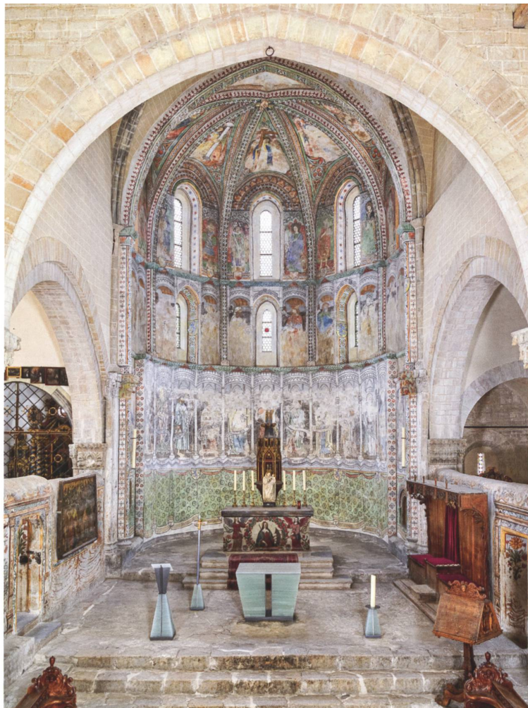
Vue vers l'est du chœur avec le nouveau mobilier liturgique en verre fusionné.

Les Monuments d'art et d'histoire du canton du Valais VIII. Le bourg capitulaire et l'église de Valère à Sion. Chantal Ammann-Doubliez, Ludovic Bender, Karina Queijo et Romaine Syburra-Bertelletto Prix en librairie 120 CHF ISBN 978-3-03797-792-7