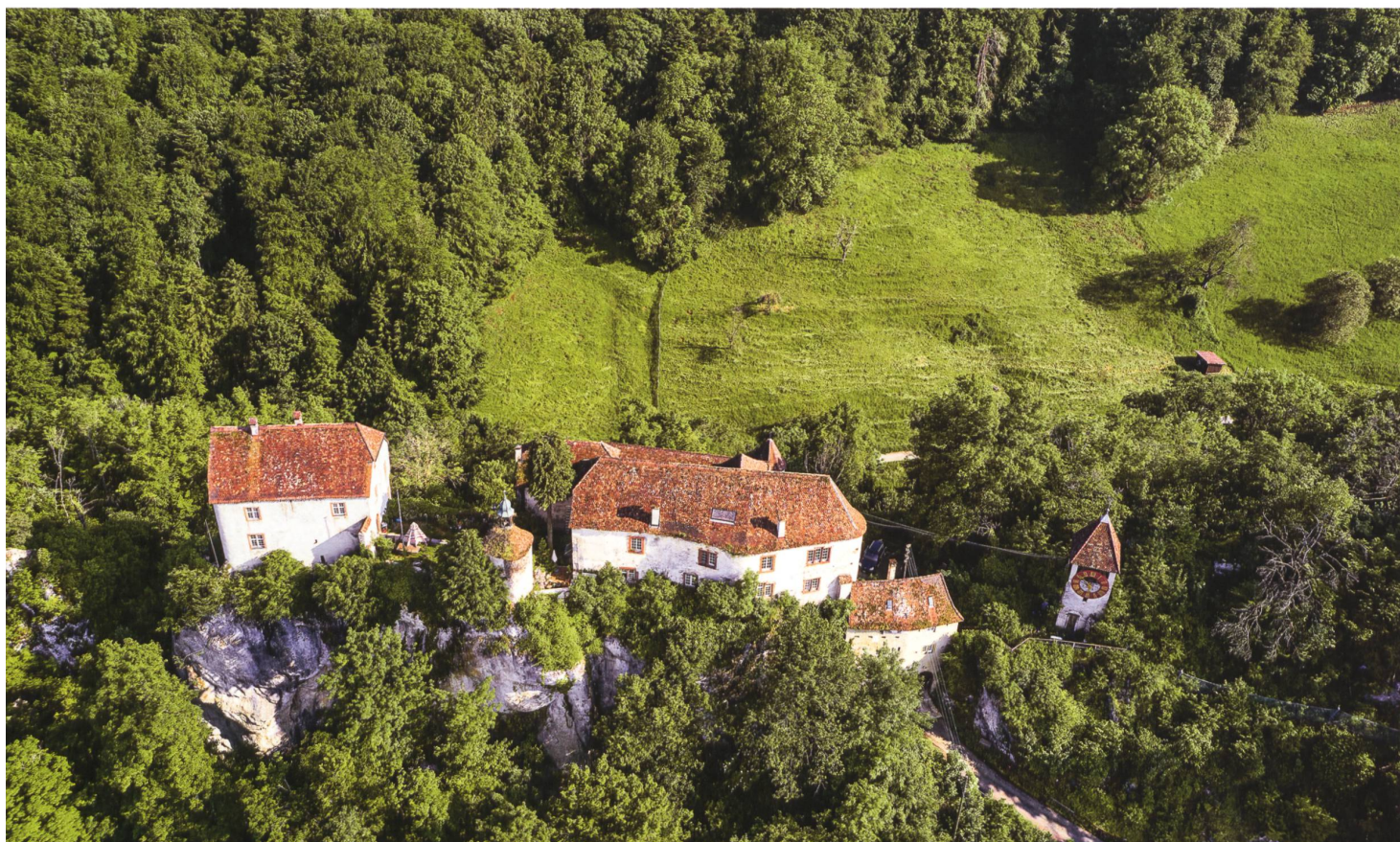
Burg im Leimental. Schloss Biederthal. Luftaufnahme von Norden.

Mit dem Band «Der Bezirk Laufen» wird 53 Jahre nach der Veröffentlichung des ersten Kunstdenkmälerbands die Erstinventarisierung des Kantons Basel-Landschaft abgeschlossen. Ist die Arbeit nun getan? Wie könnte es weitergehen? In fünfzig Jahren hat sich die Methodik der Denkmalkunde und Kunstgeschichte geändert, es stehen mehr Forschungsergebnisse zur Verfügung, und auch die Inventarisationsrichtlinien der KdS gingen mit der Zeit. Der Betrachtungshorizont wurde z. B. bis ins 20. Jahrhundert und um verschiedene Baugattungen erweitert. So haben denn einige