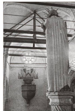
Pignon occidental. La rose polylobée après sa réouverture en 2002.