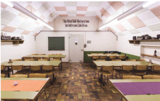
Pfäfers → 49