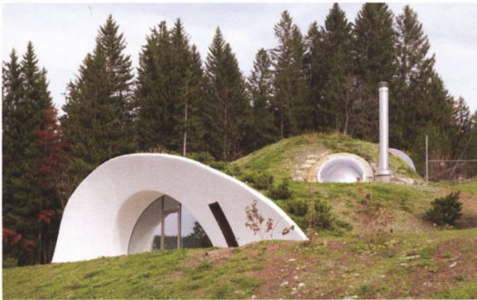
Amden → 41