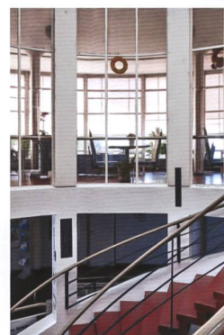
St-Ursanne: Espaces de loisirs et commerces – rocadés au fil du temps.

Die Denkmaltage greifen auch Fragen auf, die heute die Gemüter bewegen: Was passiert mit dem leeren Kinosaal, wozu dient die alte Seilbahnstation, und wie soll das baufällige Hallenbad saniert werden? Kann das ehemalige Bahnhofsgebäude zu einem Fitnessraum oder die ausgediente Turnhalle zu einem Konzertsaal umgebaut werden? Manchmal zeigt sich der historische und gesellschaftliche Wert einer Stätte erst dann, wenn sie schliesst. Während der Covid-19-Pandemie verzichteten wir zeitweise auf diese Erholungsräume. Studien zum Kulturverhalten während der Pandemie zeigen, dass die Menschen das kulturelle Erbe vermehrt schätzen lernten. Das Freizeitverhalten der Menschen wandelt sich. Und so wandeln sich auch die Anforderungen an die Orte, an denen wir Sport treiben und Kunst erleben. ●