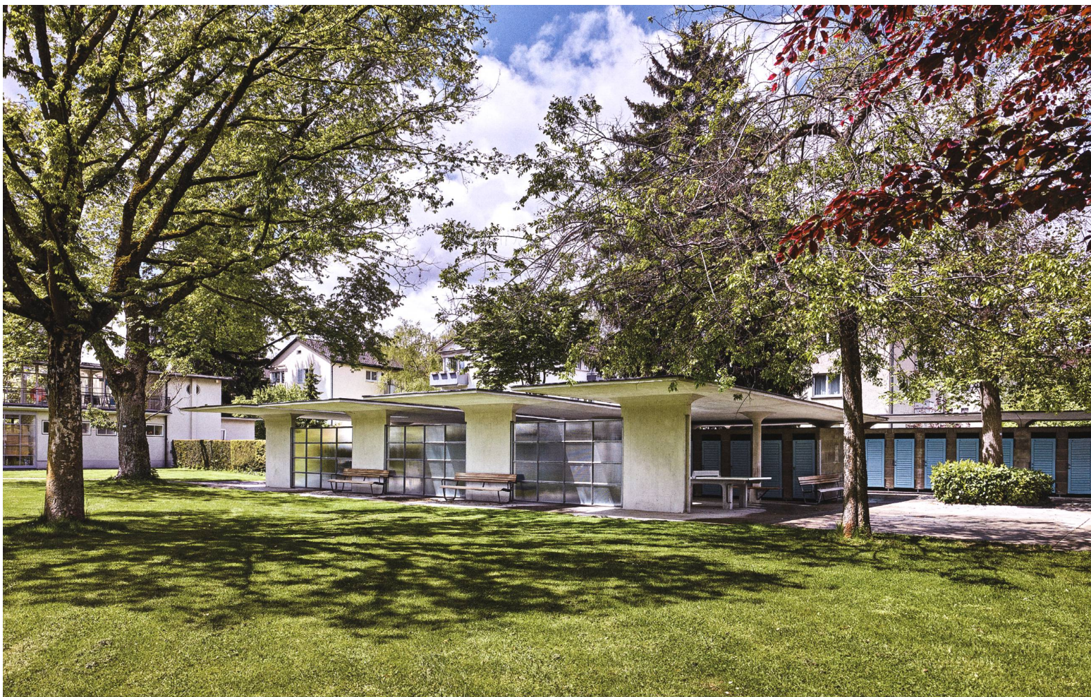
Teil der «Umkleideland-schaft»: Zwei Dächer mit kammartigen Einbuchtungen, auf schmale Wandstücke und Pilzstützen gelegt, überfangen Tischtennisplatten und Riegel von Einzelgarderoben.

Moser Steiger (HMS). Rudolf Steiger (1900–1982), hier nicht beteiligt, aber der Vordenker des Städtebaus in der Gruppe, hatte im Kontext der Bäderausstellung für das Familienbad der Zukunft die Hinwendung «zur lockeren, gelösten Anlage unter stärkster Einbeziehung landschaftlicher Werte» 7 angeregt. Für diese Aufgabe konnten die Architekten den «Gründervater der modernen schweizerischen Landschaftsarchitektur» 8 und leitenden Gartengestalter der «Landi» gewinnen: Gustav Ammann (1885–1955). Schon einmal, bei der Konzeption der Gartenflächen für die Siedlung Neubühl zu Beginn des Jahrzehnts, hatten sie kooperiert. Die guten Erfahrungen würden sich hier wiederholen.