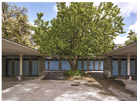
Dächer schweben frei über Umkleiden (oben), kammartige Einbuchtungen und Milchglaswände geben Transparenz und Leichtigkeit (Mitte), bepflanzte Lücken verhindern serielle Monotonie (unten).

dieser Schweizer Modernität und zugleich den Grund für die erfolgreiche Kooperation mit Gustav Ammann. Denn fraglos war dieser es, der dem Allenmoos eingepflanzt hatte, woran Moser kaum glauben mochte: das Heimelige.