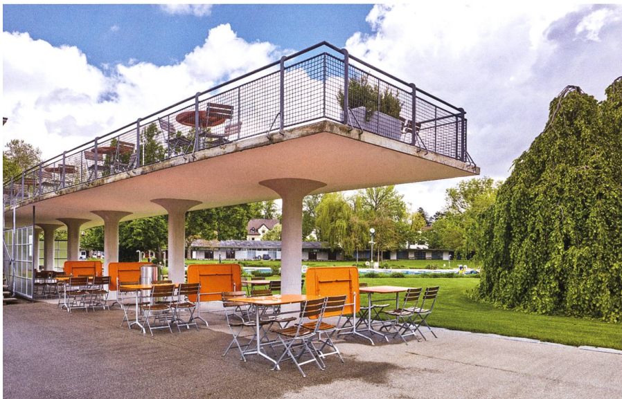
Der Restaurantkomplex, kunstvolle Verschränkung zweier Elemente – Wirtschaftsgebäude und Terrassenanlage – lässt viele maritime Assoziationen zu.

oder gar einen Stil suchen wollen, sich frei machen, das sollte die Lehre sein» 13 , schrieb er sein Leben lang. Diese Haltung half ihm, Stile loszulassen und auf neue zuzugehen. Moser und Haefeli, die umgebungssensiblen Modernisten, und der Konservative, der es wild liebte, sobald eine Landschaft gebändigt war, ergaben das ideale Gespann. Auf die Idee, die Bassins mit Vegetation zu umwuchern, waren sie unabhängig voneinander gekommen. Das Schwimmerbecken, im Sprungbereich gerade genug aus dem Rechteck herausgeknickt, um einen asymmetrischen Gefühlswert zu geben, vergräbt sich in Uferbepflanzung. Noch freier, als