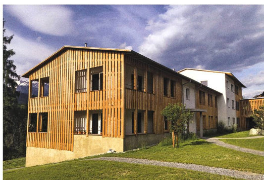
Valendas → 21