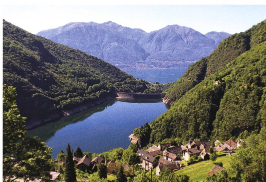
Valle Verzasca → 59