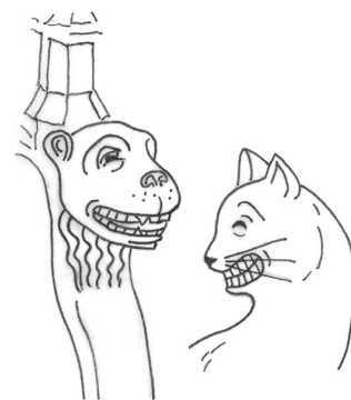
Dieser Löwe befindet sich an der Trennwand zwischen zwei Sitzen.

«Nein, du Holzkopf!», ruft Lila. «Weil wir Mäuse jagen, die dann den Menschen den Käse nicht wegfressen!» ●