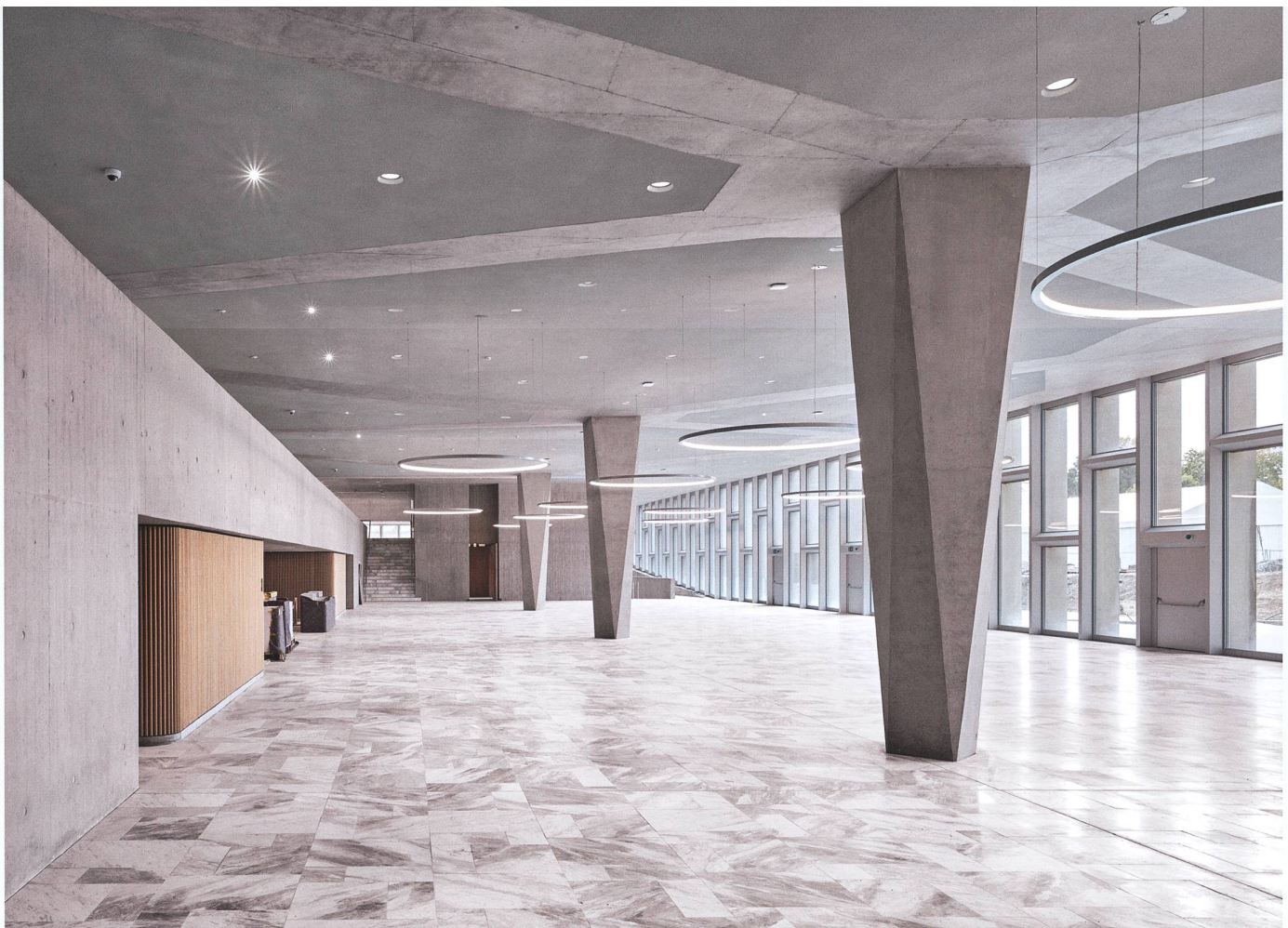
In der unteren Ebene des Restaurants tritt die Verbindung mit dem Aussenraum und Park eindrücklich zutage.

Man wird das WHO-Hauptquartier auch in Zukunft über das Gebäude A betreten. Neben dem sofort sichtbaren Administrationsbau ist der Sockel der zentrale Bauteil, der den Hauptbau mit dem Büroturm verbindet. Da Sie die öffentlichen Räume dort hineingesetzt haben, ist der Sockel wesentlich mehr als nur Verbindung. Haben Sie hier aus der Not der Verbindung die Tugend eines neuen Zentrums geschaffen?