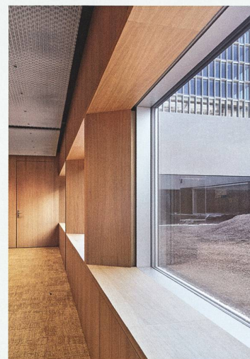
Die Büros im Turm bieten Weitsicht, und auch der Konferenzsaal ist visuell mit dem Park verwoben.

Erweiterungsbau, Genf, Nachkriegsmoderne, Jean Tschumi, WHO