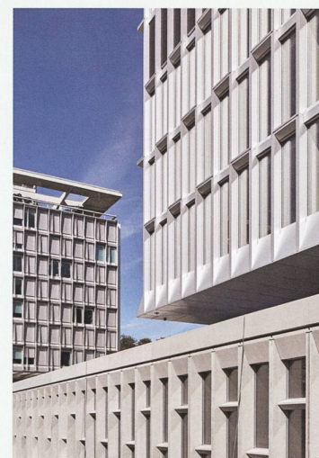
Aussenansicht des Administrationsturmes auf dem neu errichteten Sockelgeschoss (oben) mit Blick zum Hauptgebäude von Jean Tschumi (unten).

Die WHO kam in den letzten Jahren vermehrt in Kritik, da sie in der öffentlichen Wahrnehmung zunehmend zu einem politischen Instrument geworden war. Wir haben gleich zu Beginn das grosse Anliegen gespürt, sich weder durch nationale und politische