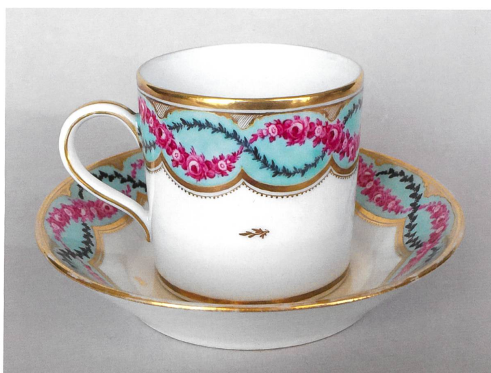
Fig. 11 Bol à bouillon (H. 10,5 cm, L. 16,8 cm) et présentoir (D. 18 cm), vers 1790, à décor de guirlandes florales et or, rang de motifs arrondis entre galons, filet pointillé et chutes or d'une rare finesse. Vendu 250 francs chez Koller à Zurich le 23 septembre 2018, lot 8439. Coll. part.