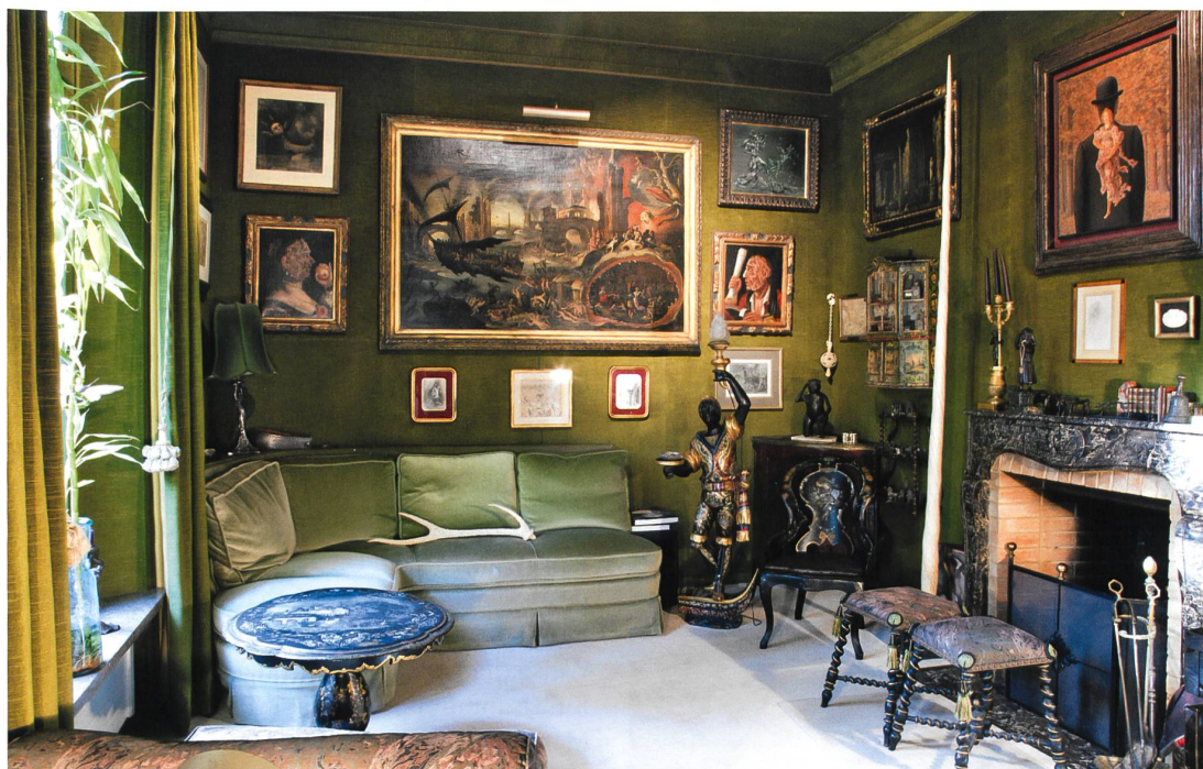
Auch private Sammlungen lassen mancherorts Reminiszenzen an die Kunst- und Wunderkammern wieder aufleben, wie dieses Beispiel aus der Schweiz zeigt. Neugier am Objekt und kennerschaftliche Vereinigung ergänzen sich.