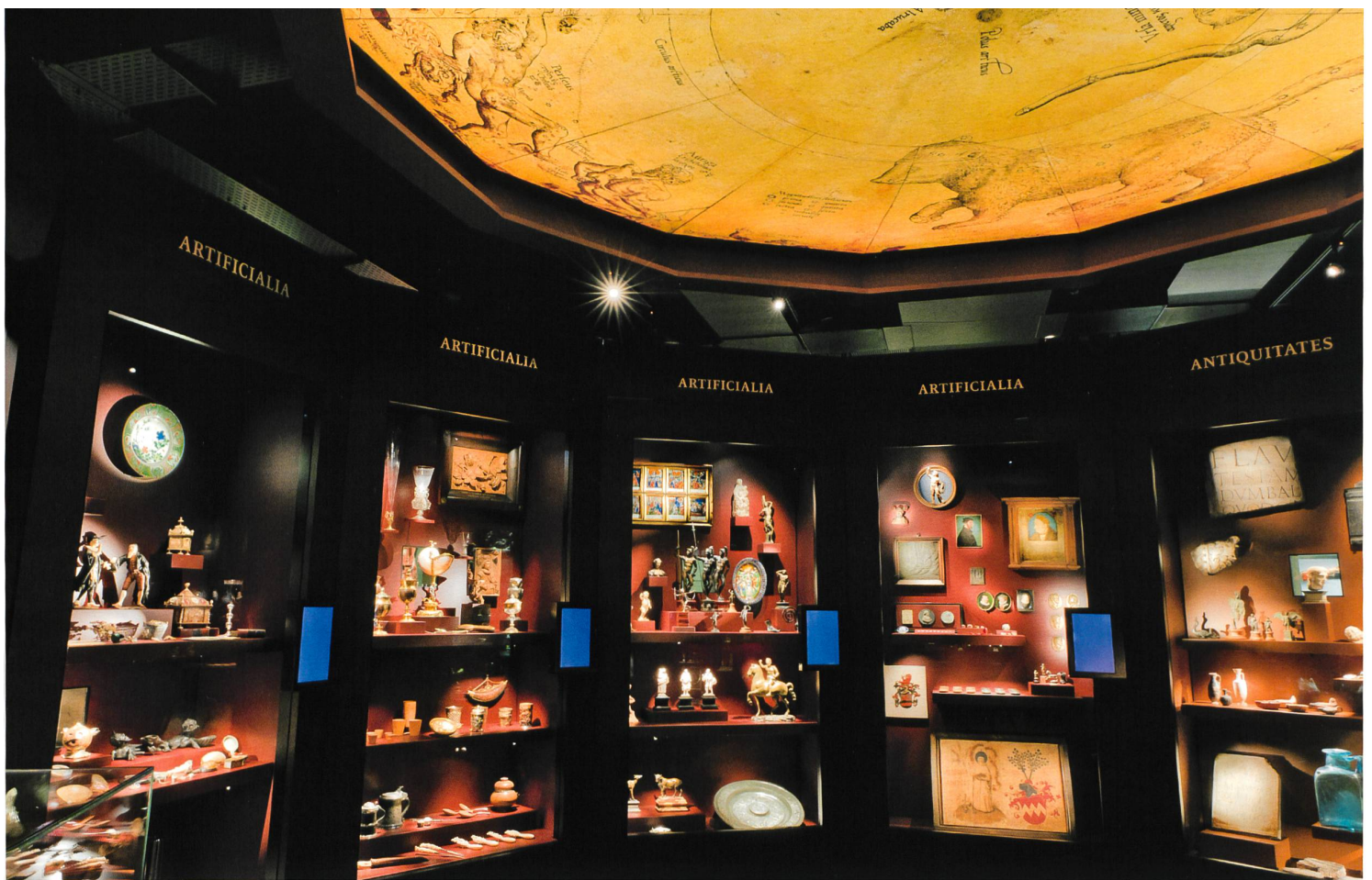
Ausstellung des Amerbach-Kabinetts im Historischen Museum Basel. Die Präsentation bemüht sich, den Charakter der Kunst- und Wunderkammer einzufangen.

struktion des Amerbach-Kabinetts wieder aufleben zu lassen. Von den Amerbach selbst wissen wir leider nicht, wie sich ihr Verhältnis im Einzelnen gestaltete. Es sind keine Berichte über Besuche auswärtiger Gäste in ihrem Haus in der Rheingasse im heutigen Kleinbasel bekannt. Das Haus selbst hat auch Veränderungen erfahren, es zeugt nichts mehr von der Amerbach'schen Sammlung dort.