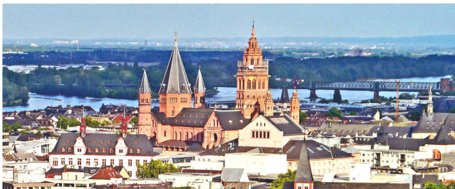
Aussicht auf den Dom zu Mainz.