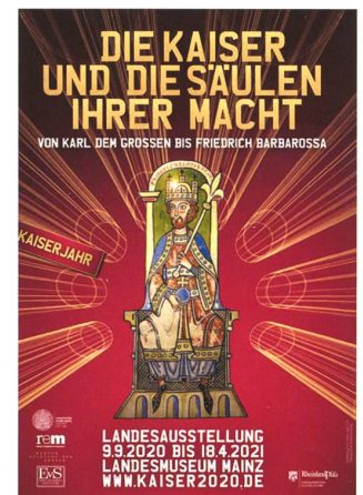
Sonderausstellung in Mainz.