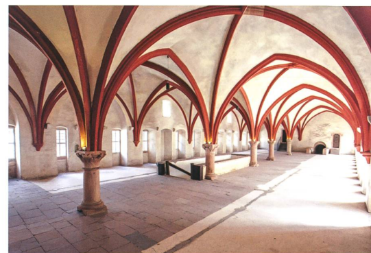
Im Zisterzienserkloster Eberbach.