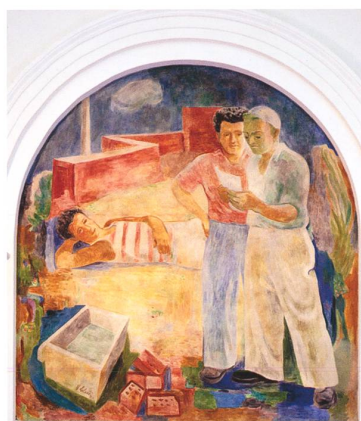
Lugano → 38