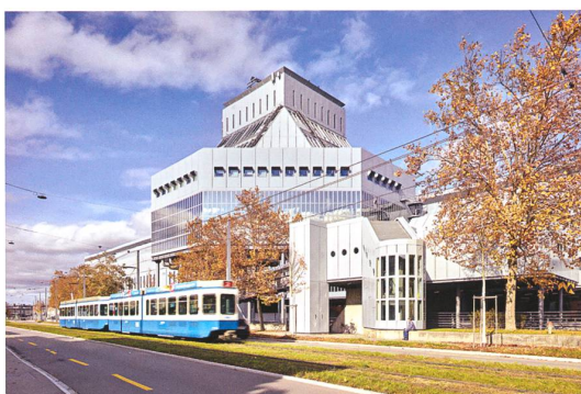
Zürich → 17