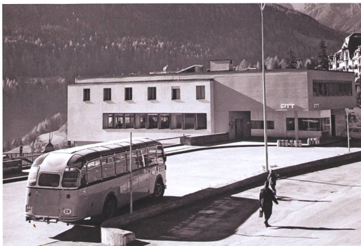
Scuol → 10