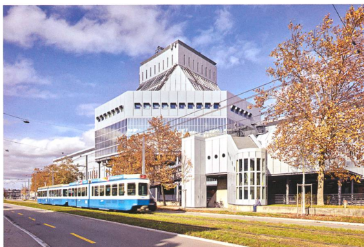
Zürich → 17