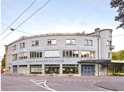
Biel → 17