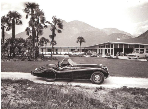
Losone → 22