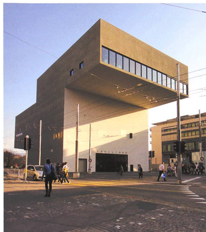
Das Théâtre Equilibre in Freiburg i.Ue.

Nous nous réjouissons de votre participation!