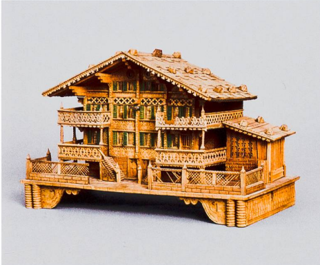
Brienz → 15