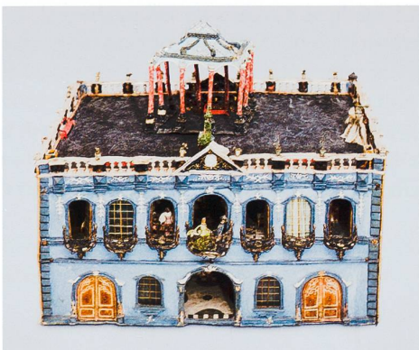
Neuchâtel → 52