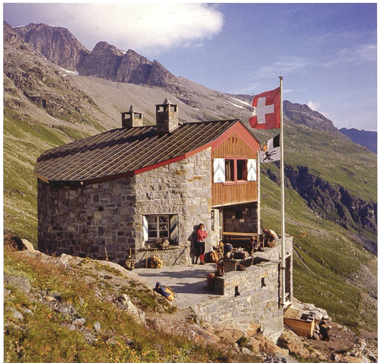
Abb. 9 Bordierhütte im Mattertal VS, 1927 in traditioneller Steinbauweise des 20. Jahrhunderts erbaut. Aufnahme um 1960