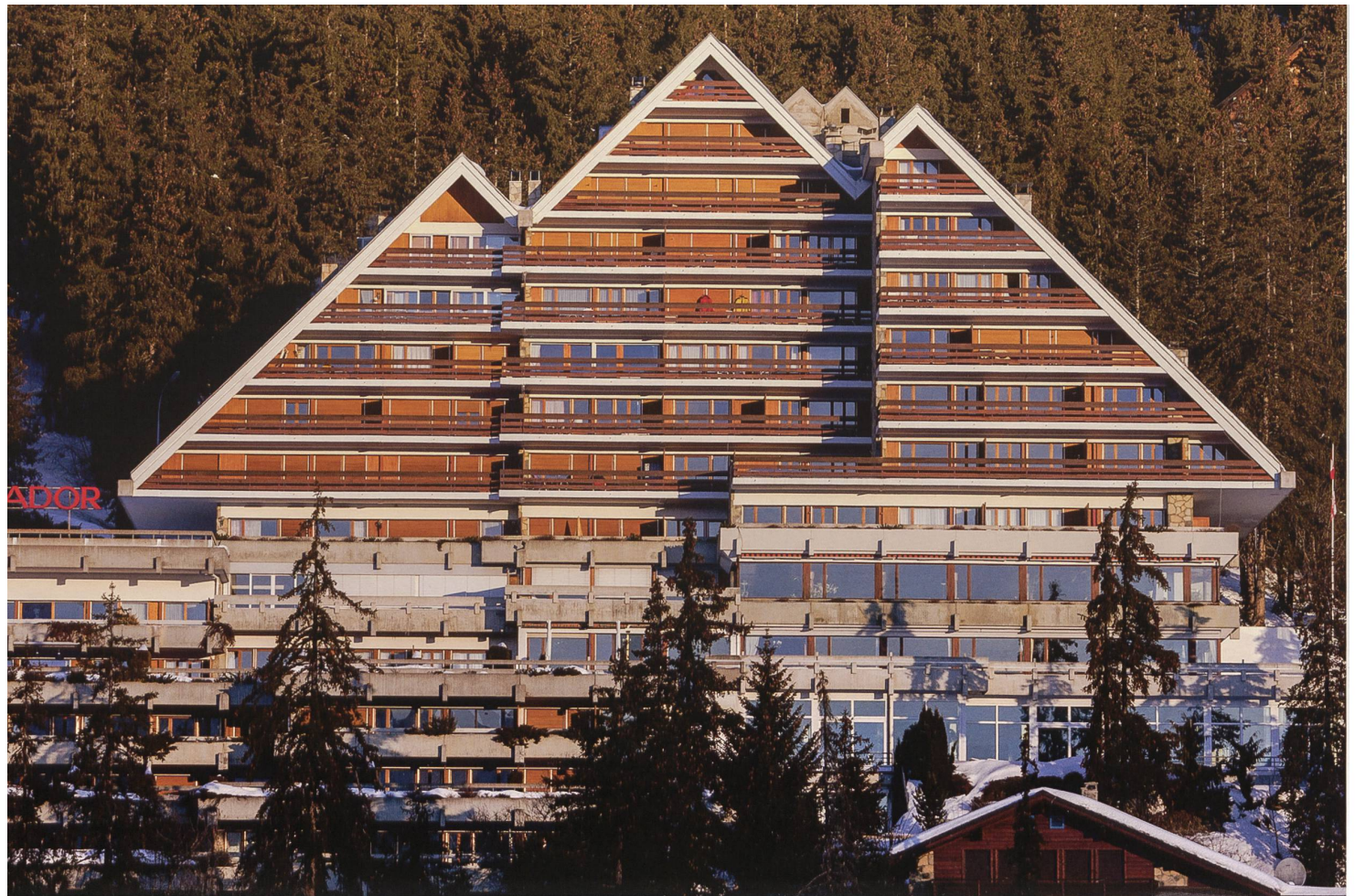
Abb. 16 Crans VS. Die eigenwillige Architektur des 1972 eröffneten Hotels Ambassador in Crans fand kaum Nachfolger in den Schweizer Alpen (Sammlung des Autors)

In der Schweiz fand die neue Bauweise neben zahlreichen Wohngebäuden vor allem in den damaligen Lungenkurorten grosse Verbreitung: Davos und Arosa in Graubünden sowie Montana und Leysin in der Westschweiz gehörten zu den Zentren dieser Entwicklung. Dazu kamen einige Fremdenverkehrsorte, bei denen die Bettenkapazität Nachholbedarf aufwies und die deshalb, trotz Hotelbauverbot, zu neuen Hotelbauten kamen, wie beispielsweise Villars und Crans in der Westschweiz oder Lenzerheide und Unterwasser in der Deutschschweiz. 15 Zu den bekanntesten, immer wieder erwähnten Bauten dieser Epoche gehören im schweizerischen Alpenraum das 1930 in Crans-Montana als Sanatorium eröffnete «Bella Lui», ein Gemeinschaftswerk der Architekten Rudolf und Flora Steiger-Crawford (1900–1982; 1899–1991) mit Arnold Itten (1900–1953), oder das Sanatorium Clavadel bei Davos nach Plänen des einheimischen Architekten Rudolf Gaberel (1882–1963). Zu den wenigen reinen Hotelbauten aus dieser Zeit gehört das Doppelhotel Alpina-Edelweiss in Müren des Thuner Architekten Arnold Itten, bei dem kurz zuvor der später berühmte niederländische Architekt Mart Stam (1899–1986) gearbeitet hatte (Abb. 11). 16