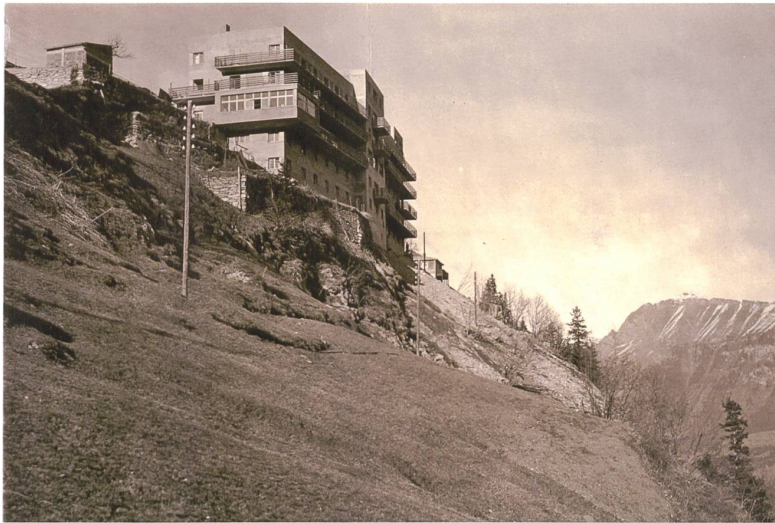
Abb. 11 Mürren BE, Hotels Alpina und Edelweiss. Die beiden zusammengebauten Hotels entstanden nach einem Brand der Vorgängerbauten in einer kompromisslosen Moderne nach Plänen des Thuner Architekten Arnold Itten (Sammlung Daniel Wolf, Bern)

Ingenieurs Beda Hefti. Foto um 1950 (Fotoarchiv Kunstanstalt Brügger, Meiringen. Alpines Museum der Schweiz, Bern)