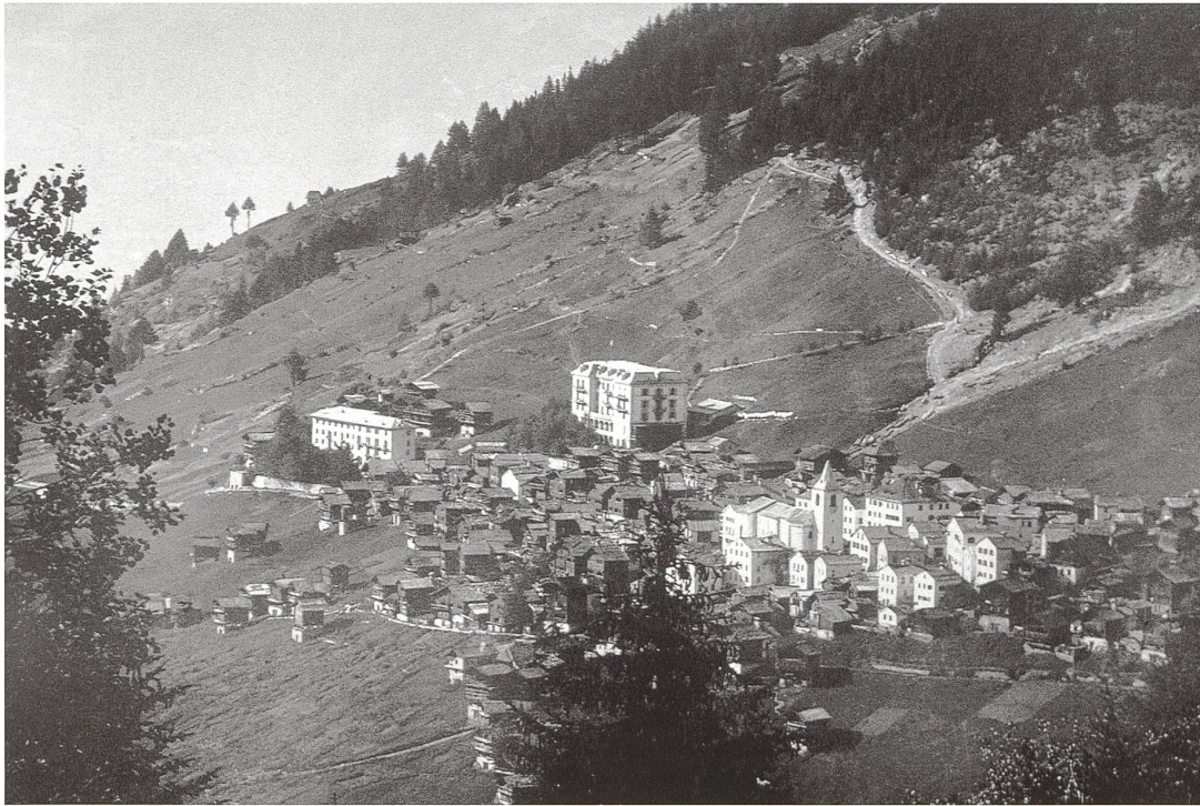
Abb.5 St-Luc VS. Ansicht des Dorfes St-Luc um 1900 mit dem nach dem Brand von 1858 in Steinbauweise wieder aufgebauten Dorfkern, dem Hotel Bella Tola (links, 1882/83 erbaut, 1889 erweitert) und dem Grand Hôtel du Cervin (1893 eröffnet)