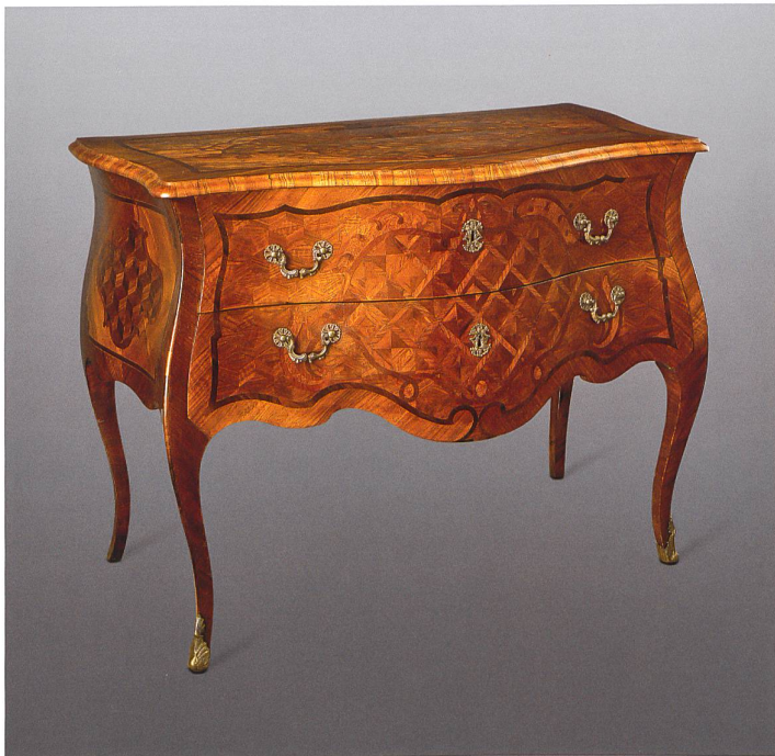
Schrank aus dem Zunfthaus der Spinnwetternzunft von Jakob Ramsperger, 1769, heute im Historischen Museum Basel, Inv.-Nr. 1931.491. Depositum E.E. Zunft zu Spinnwettern.