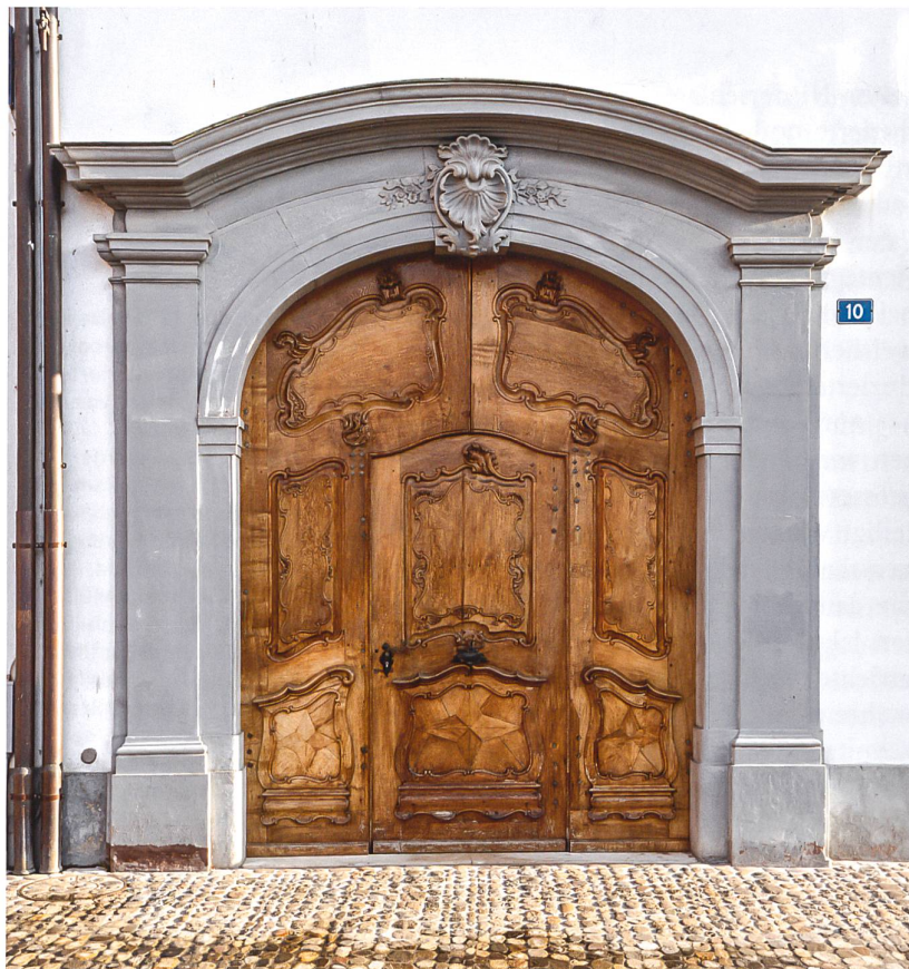
Eingangstor des Registerhofes, Münsterplatz 10. Von Jakob Ramsperger, 1780er Jahre.

Museum Basel befinden. 7 Auch als 1785–1788 das Innere des Münsters restauriert wurde, erging der Auftrag für sämtliche Schreinerarbeiten an Jakob Ramsperger. In den 1780er Jahren schuf er überdies ein neues Eingangstor, Kamintüren, Fussböden, Jalousien und Lambris für den damals umgebauten Registerhof (Münsterplatz 10).