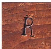
Brandstempel von der Rückwand der Kommode oben. Die ligierten Initialen IR könnten auf Jakob Ramsperger als Hersteller oder als Zwischenhändler hinweisen.