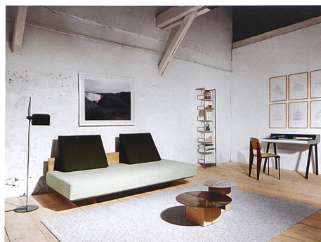
Lausanne → 51