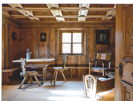
St. Moritz → 18