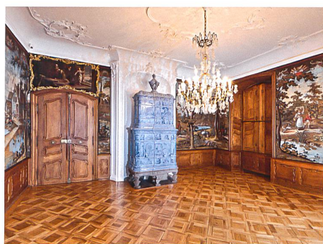
Basel → 32