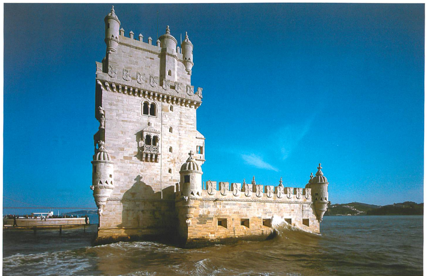
Torre de Belém