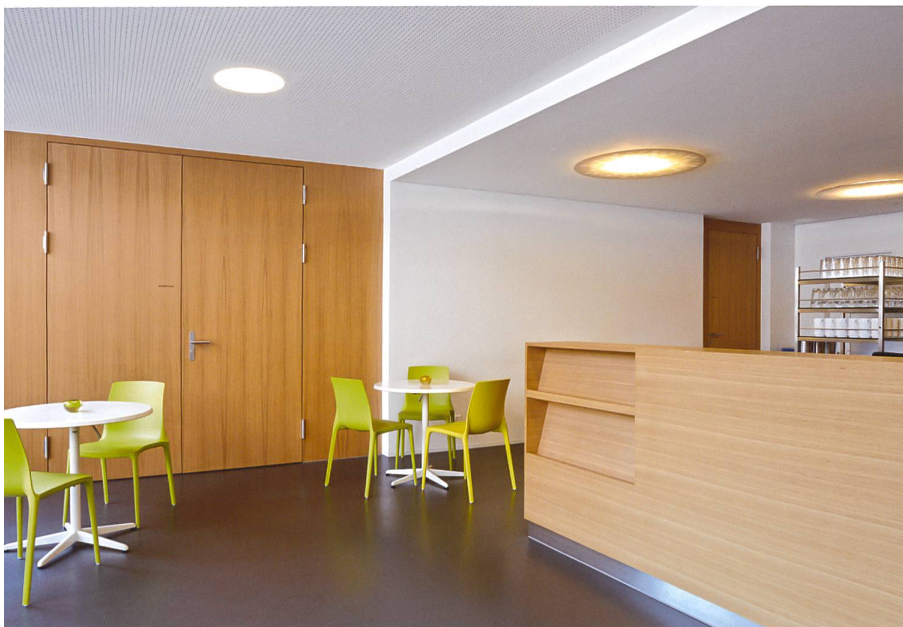
Vielfältig genutzte Innenräume nach der Sanierung: oben der Saal des Pfarreizentrums, unten das Café.

nungen eine neue Einnahmequelle erschlossen werden.