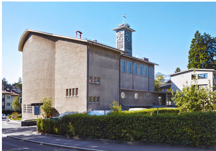
Beim Umbau des Pfarreizentrums St. Josef zum Quartierzentrum «Der MaiHof» wurde die Gebäudehülle dezent modernisiert (Bild unten nach der Sanierung).

sche Entscheide, wozu auch die Umnutzung von Kirchengebäuden gezählt werden kann, werden in Kirchenpflegen und Synoden getroffen und folgen nur bedingt «übergeordneten» Richtlinien. Trotz dieser komplexen Leitungsstruktur lassen sich gegenwärtig bei der katholischen und der evangelisch-reformierten Kirche ähnliche Herangehensweisen beobachten.