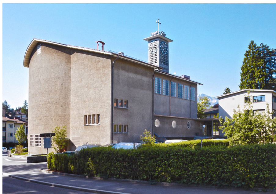
Beim Umbau des Pfarreizentrums St. Josef zum Quartierzentrum «Der MaiHof» wurde die Gebäudehülle dezent modernisiert (Bild unten nach der Sanierung).

sche Entscheide, wozu auch die Umnutzung von Kirchengebäuden gezählt werden kann, werden in Kirchenpflegen und Synoden getroffen und folgen nur bedingt «übergeordneten» Richtlinien. Trotz dieser komplexen Leitungsstruktur lassen sich gegenwärtig bei der katholischen und der evangelisch-reformierten Kirche ähnliche Herangehensweisen beobachten.