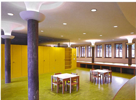
Luzern → 57