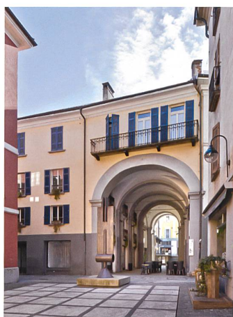
Bellinzona → 19