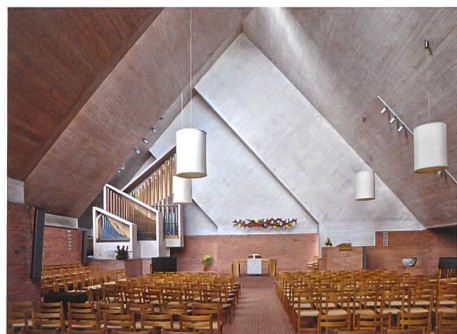
Effretikon → 9