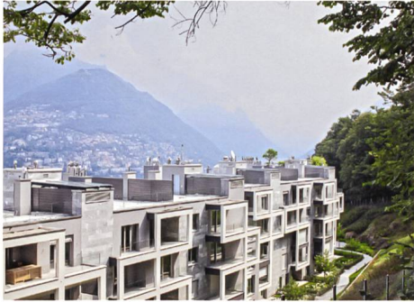
Lugano → 6