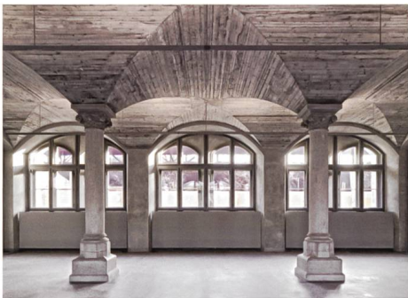
Zürich → 34