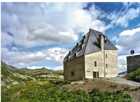
Gotthard → 58