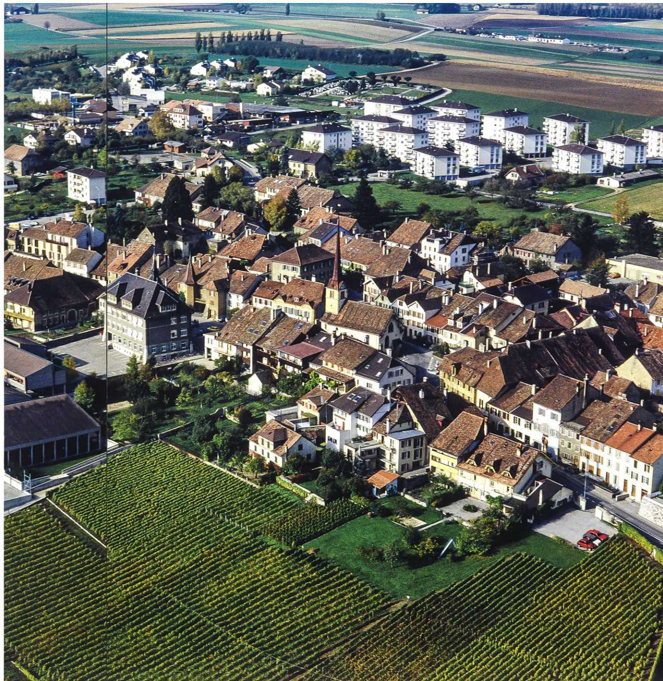
Cortailod, Luftaufnahme des Dorfs von Osten am 20.10.1980 aus einer Flughöhe von 120 m.