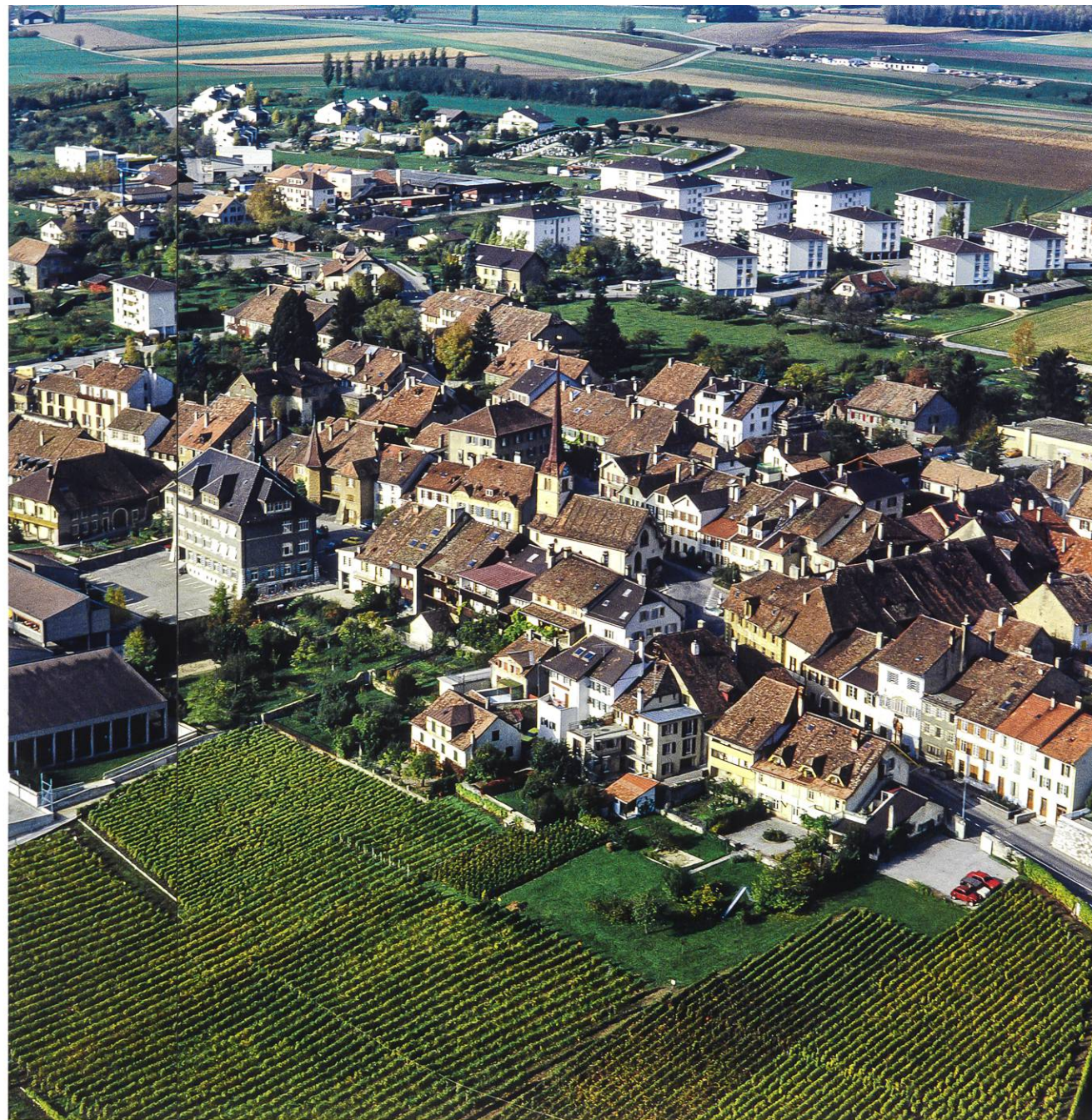
Cortailod, Luftaufnahme des Dorfs von Osten am 20.10.1980 aus einer Flughöhe von 120 m.