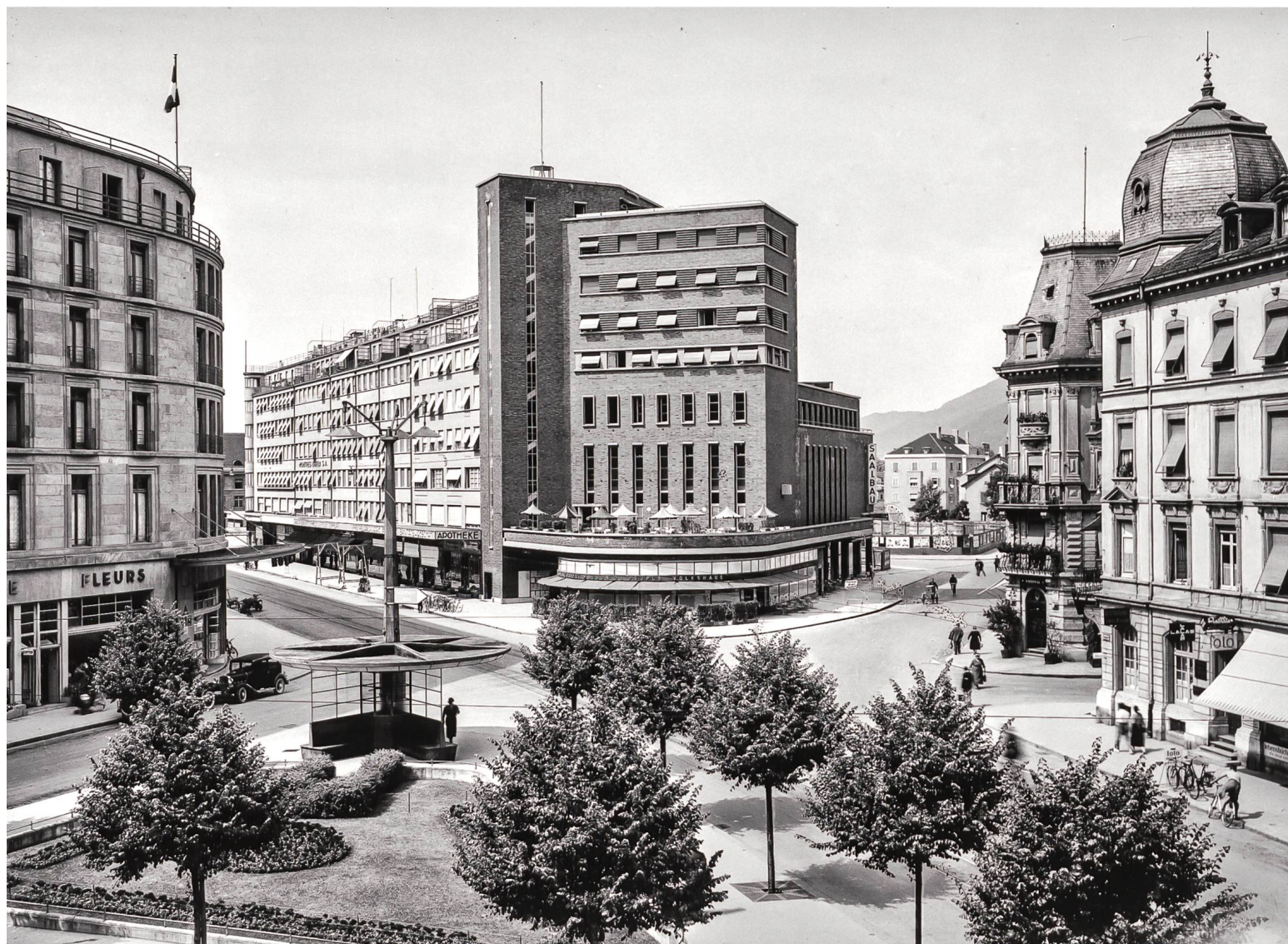
Biel, General-Guisan-Platz mit dem Volkshaus, erbaut 1930–1932 von Eduard Lanz. Foto Photoglob-Wehrli AG, Juni 1934