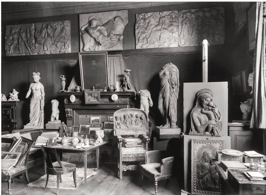
Fig. 3 Anonyme, Intérieur de l'atelier du peintre Etienne Duval , photographie. Bibliothèque de Genève, Centre d'iconographie genevoise