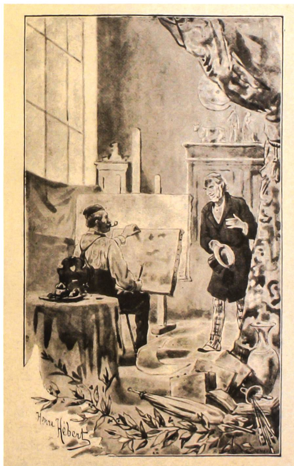
Fig. 12 Henri Hébert, L'amateur Bernichon dans l'atelier de François Diday , publié dans Emile Julliard, Trois contes genevois: un tableau de Diday , illustrations de Henri Hébert, Genève, 1893