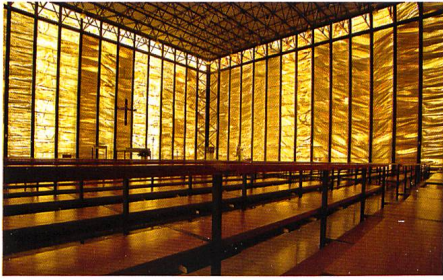
Meggen → 8