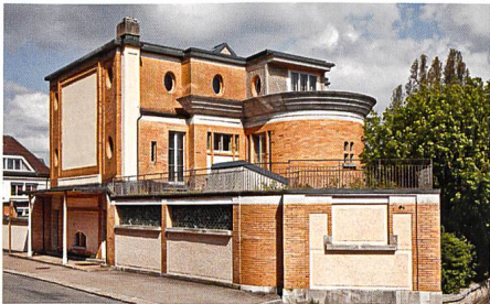
La Chaux-de-Fonds → 20