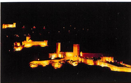
Bellinzona → 36