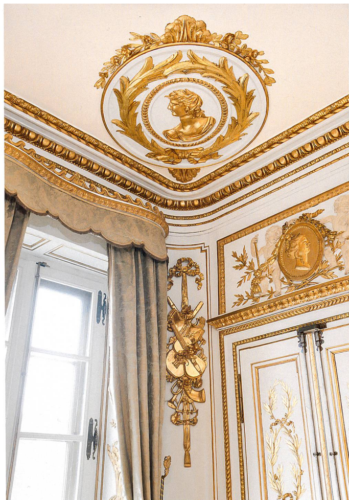
Angle sud-ouest : au centre, Neptune et la Musique