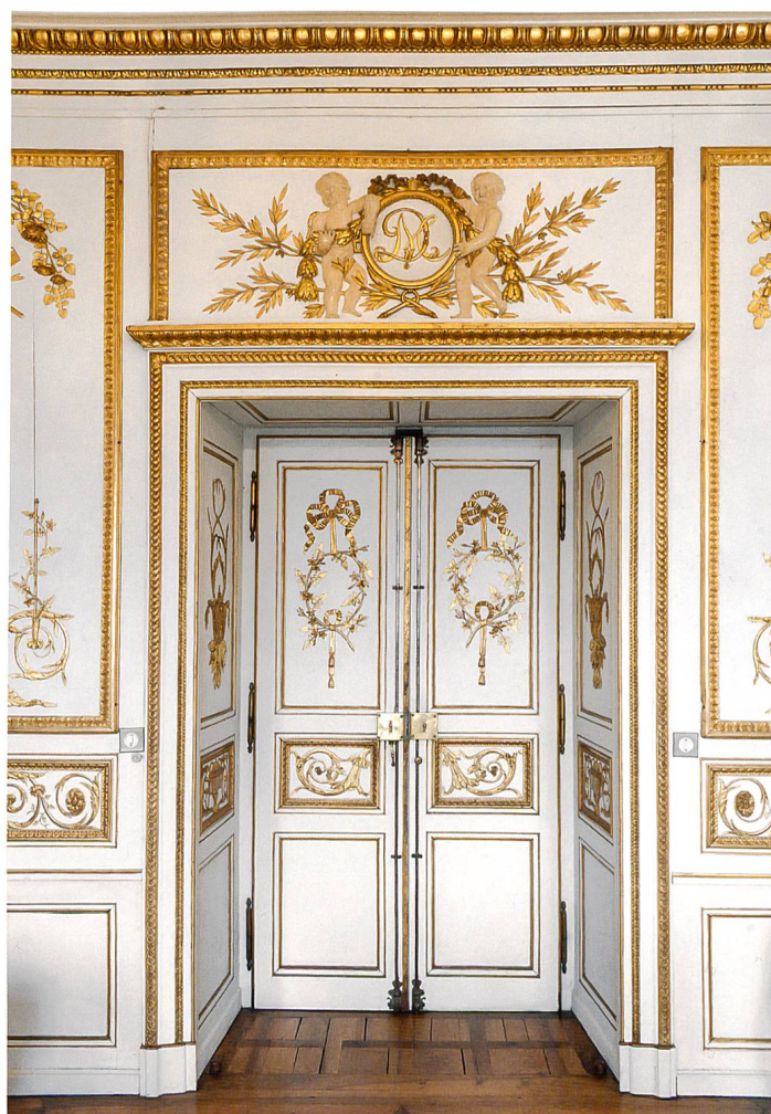
Porte principale du salon et dessus-de-porte au monogramme de la famille de Meuron

que Meuron et Guignard connaissaient certainement : le grand salon de l'Hôtel DuPeyrou à Neuchâtel, dont les lambris sculptés auraient été livrés directement de Paris en 1771 6 . Dans le cas du Pommier 7, aucun élément ne semble indiquer une provenance étrangère des lambris. Il est en revanche probable que Guignard ait fait appel à un sculpteur sur bois spécialisé, qui aurait travaillé à l'ornementation remarquable des lambris et du mobilier : les sources évoquent la présence à Yverdon, entre 1779 et 1780, d'un sculpteur et maître de dessin d'origine française, Jean-Marie Nogaret, lequel aurait par la suite affirmé avoir participé au chantier 7 .