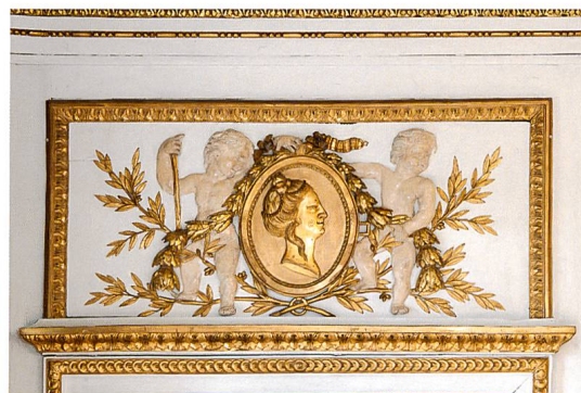
Détail du couronnement d'une glace : nymphe et satyre