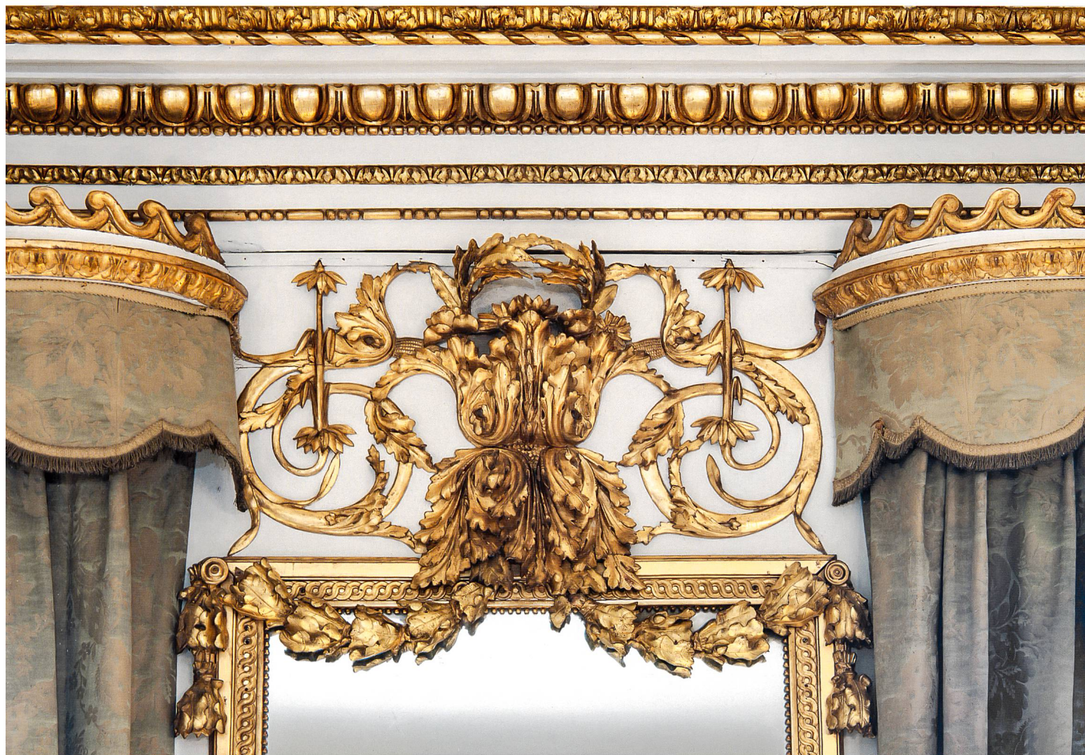
Détail du couronnement d'une glace au trumeau des fenêtres: acanthes, rinceaux et guirlandes de fleurs