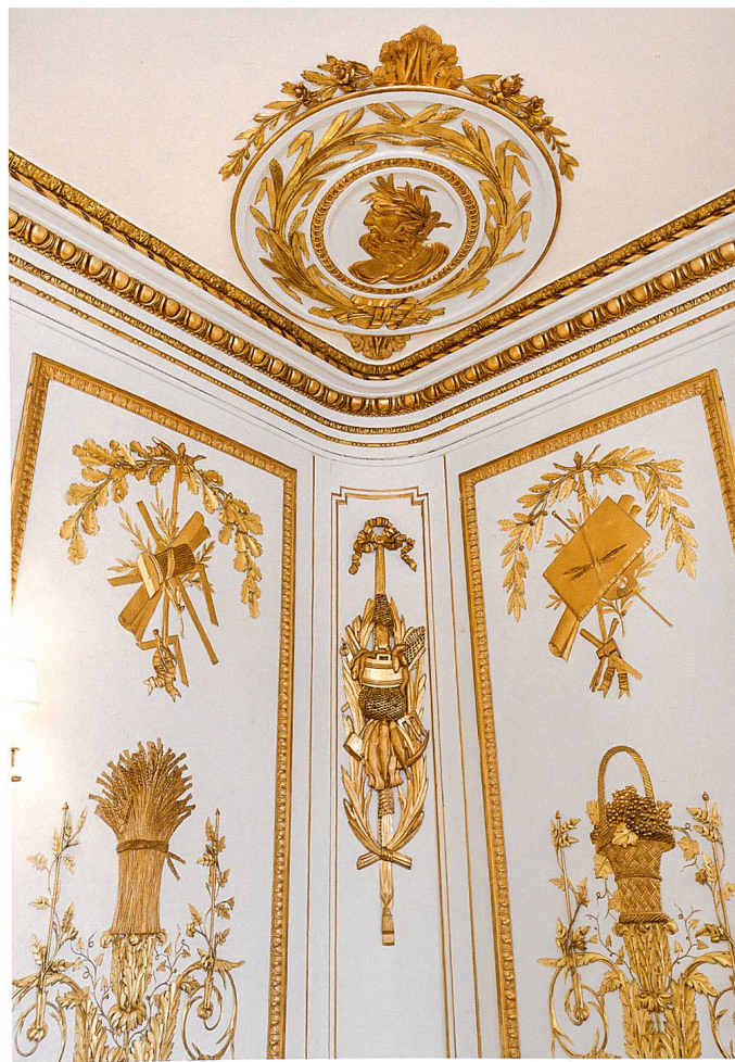
Angle nord-est : au centre, Neptune et la Pêche ; de part et d'autre, l'Architecture et la Peinture

bordé de grecques, une sculpture dorée représente Jupiter sur un char tiré par un aigle, entouré de nuées et de foudres.