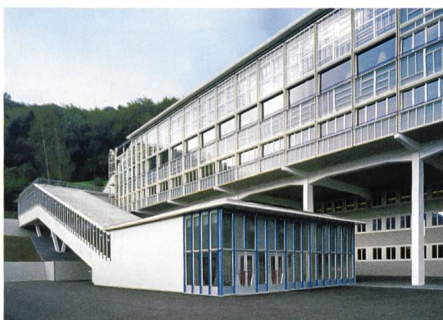
Baden → 35