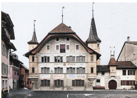
Büren an der Aare → 56