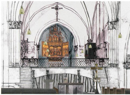
Chur → 13