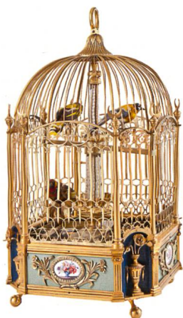
Seewen → 39