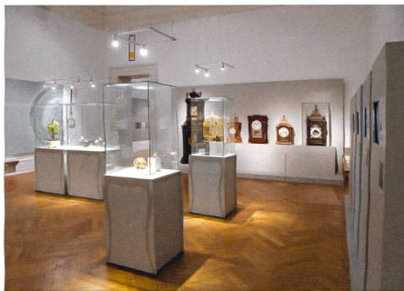
Neuchâtel → 11