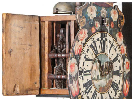
Appenzell → 54