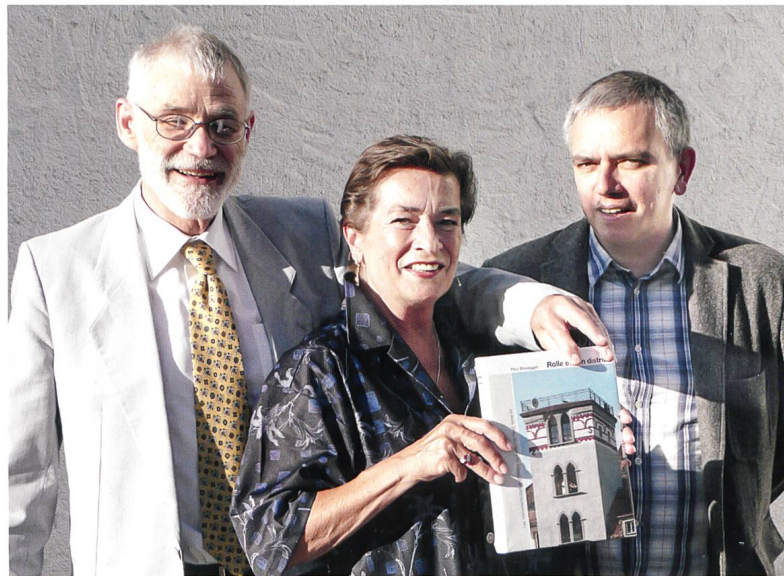
L'auteur Paul Bissegger, Catherine Courtiau, rédaction scientifique, Hans Weidmann, réalisation technique.

Pour terminer, le vin d'honneur de la Commune, gracieusement offert par la Municipalité de Rolle, a été servi à l'extérieur du Temple sous les chaleureux rayonnements du soleil couchant, belle consécration d'un ouvrage qui mérite tout éloge. ●