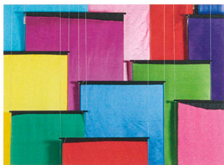
Satin double face → 6