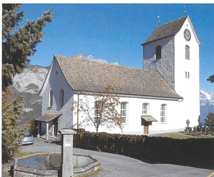
Pfarrkirche in Obstalden