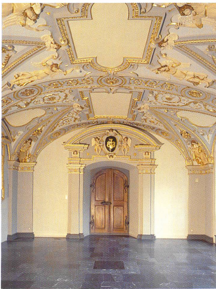
Sala Terrena, Freulerpalast

Die Jahresversammlung der GSK findet am 5. Juni 2010 in Glarus statt. Das Programmheft finden Sie in dieser Ausgabe von k+a beigelegt. Wir freuen uns auf Ihre Teilnahme. Bitte beachten Sie, dass der Jahresbericht 2009 sowie die Jahresrechnung 2009 mit dem Budget 2010 neu im Programmheft abgedruckt sind. Nachfolgend finden Sie die drei Führungen, die im Rahmen der Jahresversammlung am Sonntag, 6. Juni 2010, stattfinden.