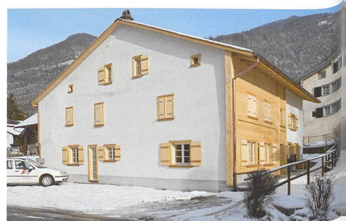
Geburtshaus des Humanisten Glarean (1488–1563)