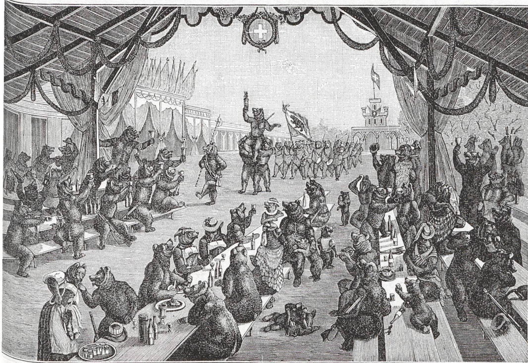
Fest der Bären.

Henri Fischer-Hinnen (1844–1898), Fest der Bären. Satirischer Blick in die Festhütte des Eidgenössischen Schützenfestes in Bern 1885. Illustration aus einer Festzeitung