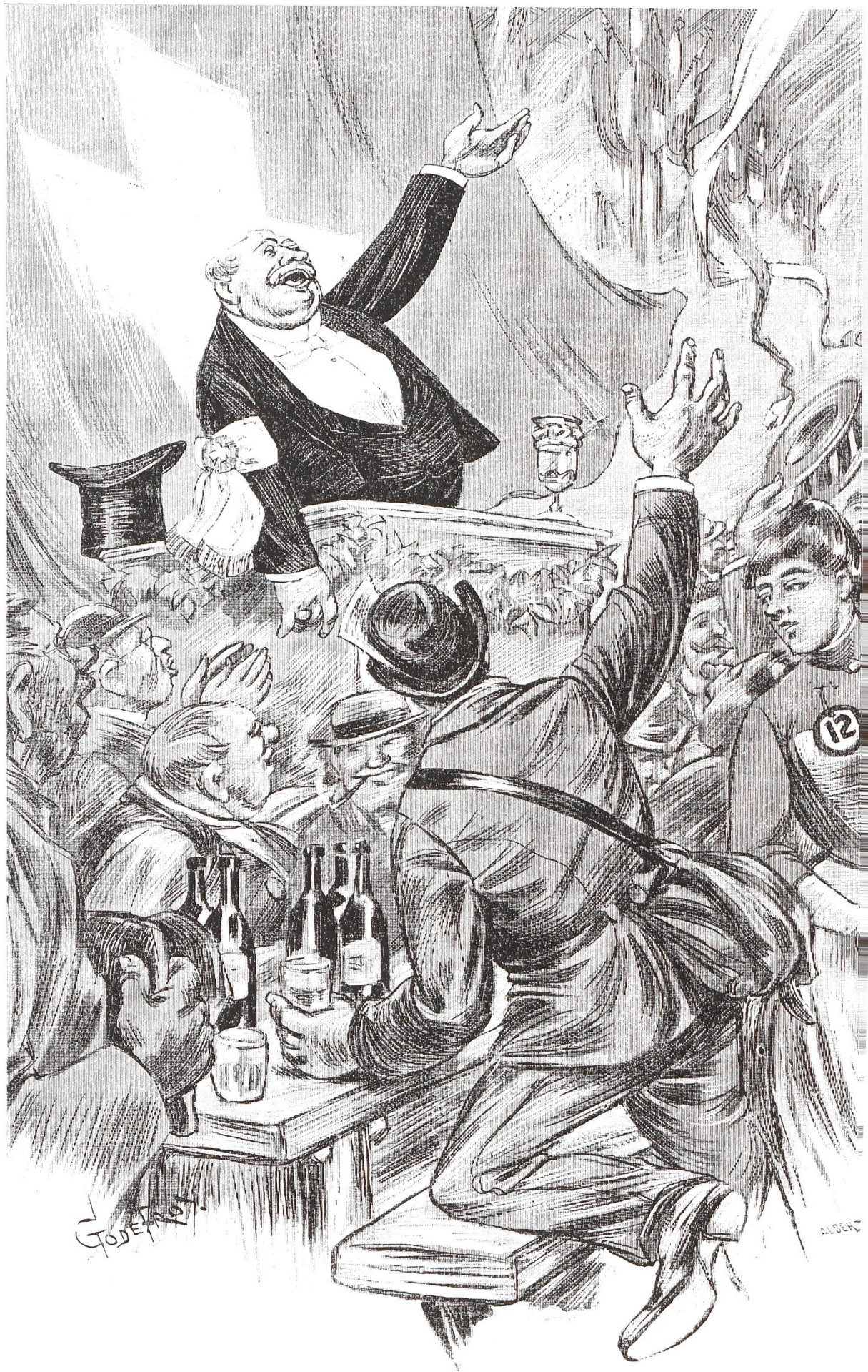
Godefroy (Auguste Constantin Viollier, 1854–1908), Festrede. Zeichnung für die Chansons romandes, deuxième série von Emile Jaques (-Dalcroze), Vevey 1892