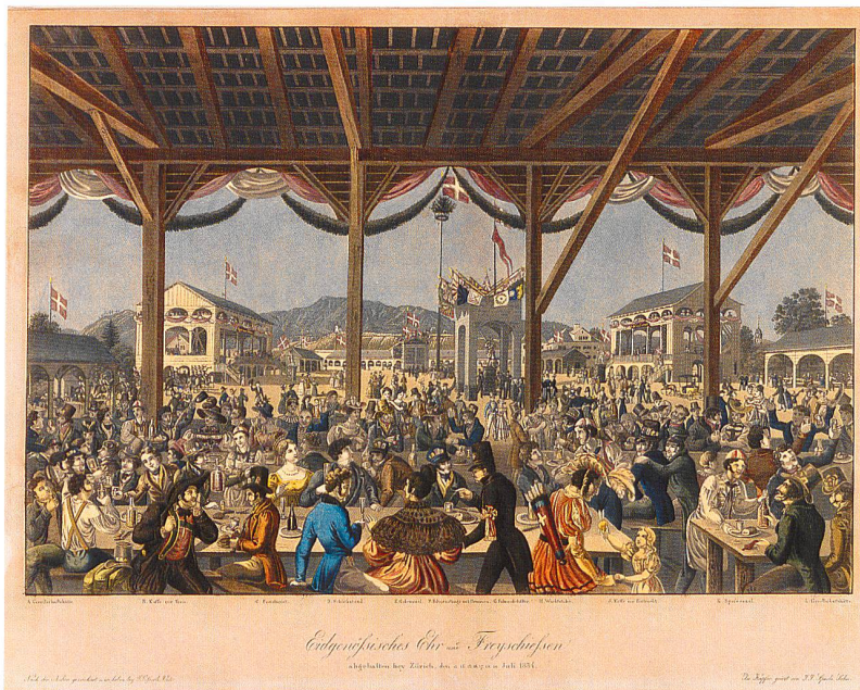
Johann Jakob Sperli (1770–1843), Eidgenössisches Ehr- und Freischiessen in Zürich, 13.–19. Juli 1834. Blick aus der Festhütte auf Fahnenburg, die Caféhäuser und das Schützenhaus. Wilhelm Tell und Sohn gesellen sich zu den Schützen (kolorierte Aquatinta 1834 LM 56193)

Als Orte der Beschwörung des Vaterlandes, der Republik und der Demokratie gingen die Bankette der grossen Verbandsfeste des 19. Jahrhunderts in die Geschichte ein. Das Bild eines freien und souveränen Volkes sollte allen vor Augen geführt werden. Doch was genau lag auf den Tellern in den Festhütten?