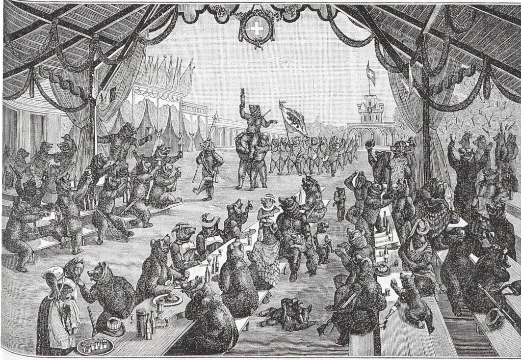
Fest der Bären.

Henri Fischer-Hinnen (1844–1898), Fest der Bären. Satirischer Blick in die Festhütte des Eidgenössischen Schützenfestes in Bern 1885. Illustration aus einer Festzeitung