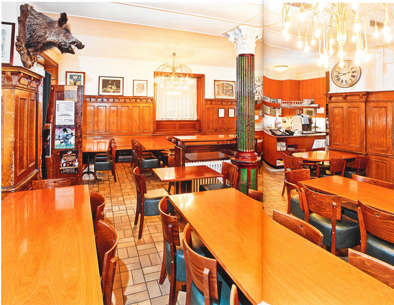
Fotoessay à table: Restaurant Hasenburg, Basel