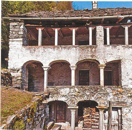
Moghegno → 12