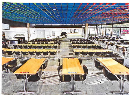
Zürich → 52