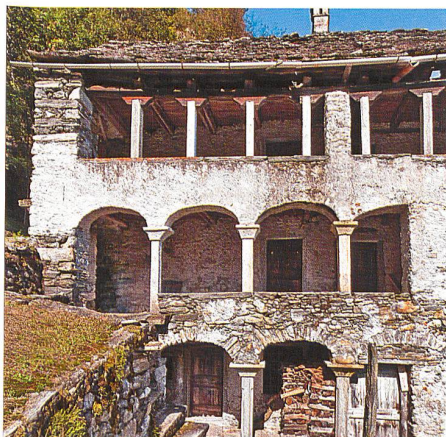
Moghegno → 12