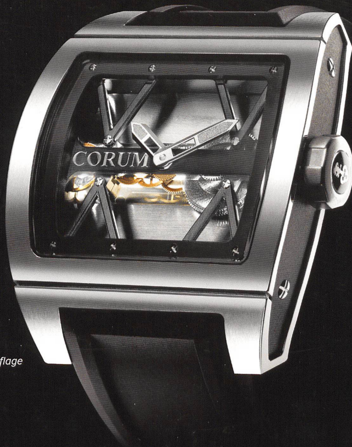
Ti-Bridge Limitierte Auflage

Die Ti-Bridge in Titan - spektakuläre Uhrmacherkunst. Exklusives Corum Manufaktur-Stabwerk C0007 mit Titan Brücken und 3 Tagen Gangreserve. www.corum.ch