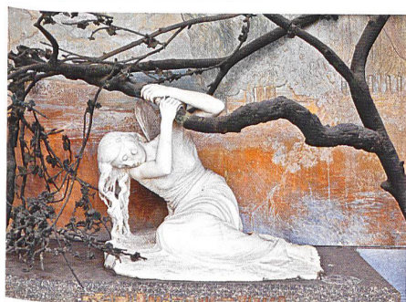
Lugano → 36