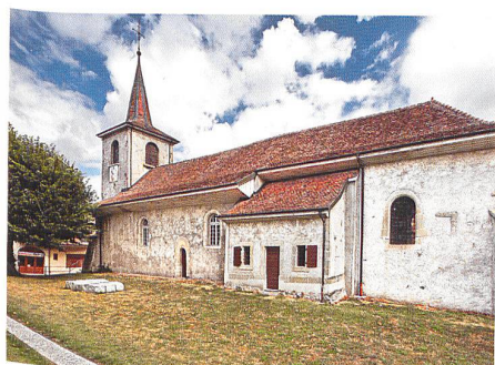
Assens → 23