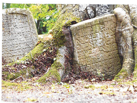
Endingen-Lengnau → 4