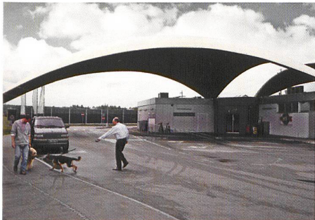
Deitingen → 18, 70