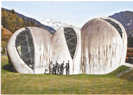
Casis → 10