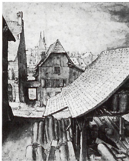
Matthaeus Merian, Merian'sche Sägemühle in Basel, 1615/16, Handzeichnung, Ecole Nationale des Beaux-Arts, Paris. (Repro, S. 17)