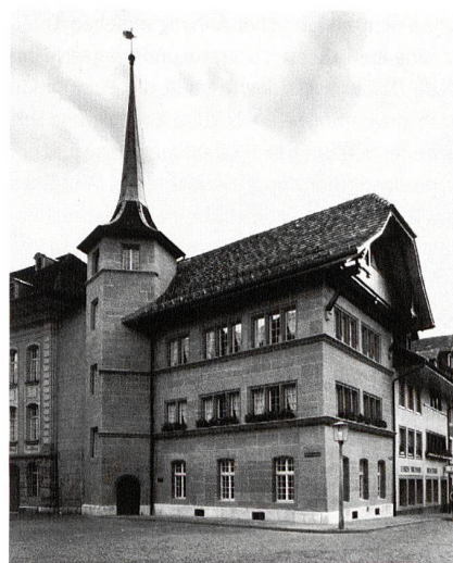
Zofingen, Zunfthaus zu Metzgern, 1603, Architekt Antoni Stab.

Als sinnvolle Ergänzung zur umfassenden Zofinger Stadtgeschichte (in vier Bänden, erschienen zwischen 1992 und 2004 in der gleichen Schriftenreihe) sind die ausführlichen Dokumentationen über die prominenten Bauten Antoni Stabs in Zofingen, seinem Hauptwirkungs-ort, anzusehen. Bis heute zeugen rund um den Thutplatz die prachtvollen Sandsteinfassaden der Helferei (1598/99), der Lateinschule (1600) und des Metzgerzunfthauses (1603) von Stabs spätgotisch geprägtem Formenschatz. Das Siechenhaus (1610) nimmt insofern eine Sonderstellung ein, als dass die um 1999 erfolgten grossen Restaurierungs- und Umbauarbeiten Walter Gfeller spezifische Einblicke in Baudetails gewährten, die bei anderen Profanbauten nicht möglich waren. Das Interesse des Autors an der