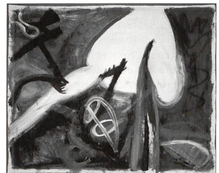
Martin Disler, Killing of a pregnant woman , 1982, Städtische Kunstsammlung, Stadt Luzern.

Die Herausgeber der ersten Monografie über Martin Disler nach seinem Tod standen somit vor der Herausforderung, dieses vielschichtige, in alle Richtungen ausgreifende Werk in einen grösseren historischen Kontext zu stellen. Franz Müller und das Schweizerische Institut für Kunstwissenschaft, die bereits 2004 mit einer umfassenden Werkdokumentation des Schweizer Künstlers begonnen hatten ( www.martin-disler.ch ), legten die Monografie auf verschiedene essayistische Untersuchungen des Œuvres an. Diese Monografie, die im Januar 2007 anlässlich der Ausstellung Von der Liebe und anderen Dämonen. Martin Disler: Werke 1979–1996 im Aargauer Kunsthaus erschienen ist, umfasst verschiedene Aufsätze zu Teilaspekten in Dislers Werk – ein grosser Platz nimmt dabei das Schreiben und Zeichnen ein, das der Künstler sowohl als eigenständigen Teil in seinem Schaffen anerkannte, als es auch als konzeptioneller Gestus generell