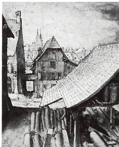
Matthaeus Merian, Merian'sche Sägemühle in Basel, 1615/16, Handzeichnung, Ecole Nationale des Beaux-Arts, Paris. (Repro, S. 17)